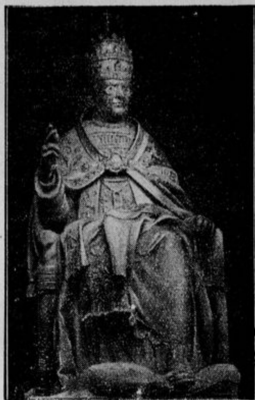
Spomenik sv. očetu papežu Piju XI. bodo povodom njegovega jubilejnega leta zgradili in junija meseca blagoslovili v njegovem rojstnem mestu Dessu v zgornji Italiji.