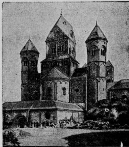
V opatiji Maria Laach bodo ustanovili mednarodno benediktinsko akademijo, na kateri se bo poučevala in raziskovala zgodovina redovništva in liturgije.

V nekem pritličnem stanovanju na Dunaju so te dni zapazili gost dim. Zakurili so namreč peč, toda dim ni šel skozi dimnik, marveč je vedno bušnil nazaj v stanovanje, tako da je bilo končno tako zakajeno, da se je en stanovalec onesvestil, ostali pa so bili v nevarnosti, da se zaduše. Poklicali so gasilce, ki so takoj odposlali dimnikarski voz. Ko so preiskali dimnik, so ugotovili, da je bil v prvem nadstropju zamašen s papirjem. Sli so v prvo nadstropje, kjer stanuje neka ločena žena. Toda ta ni hotela nikogar pustiti v stanovanje. Ker je bilo ogroženo življenje ne samo te stranke, marveč tudi drugih, so poklicali na pomoč policijo. Žena je izjavila, da bo skočila skozi okno, če bo kak tujec stopil v njeno stanovanje. Končno so s silo odprli vrata in na odredbo policijskega zdravnika, ki je med tem prišel, odpeljali ženo na opazovalnico. Ugotovili so, da je žena v svoji maniji dimnik popolnoma zamašila tako da ni mogel dim skozi in da spodaj stanujoče stranke niso mogle uporabljati niti peči niti štedilnikov.