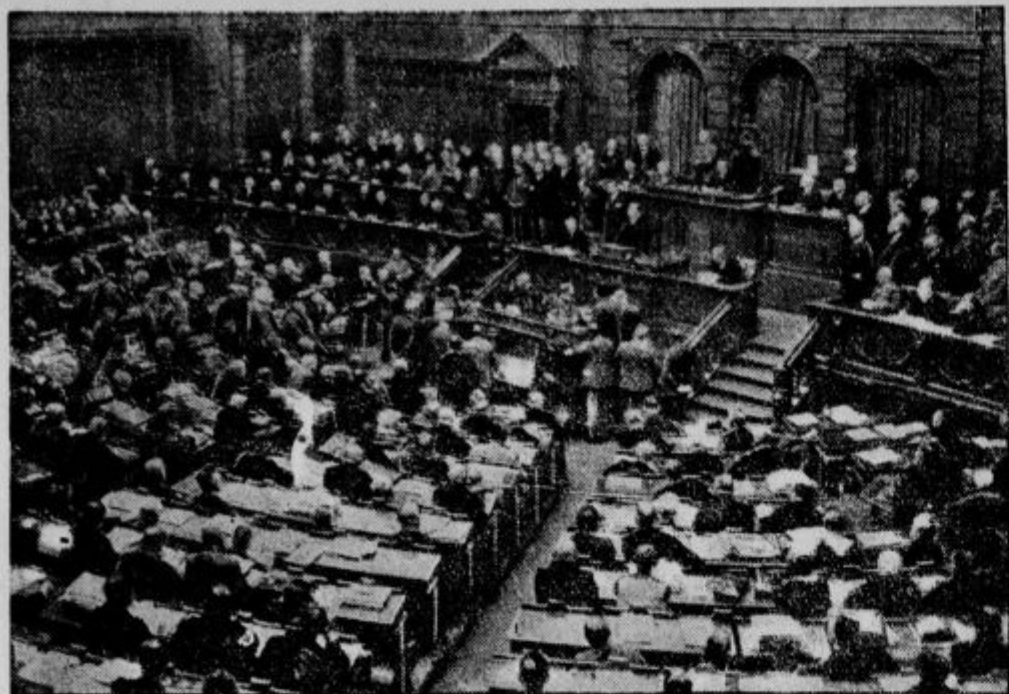
Nemški državni zbor je 3. aprila odklonil nezaupnico Brüningovi vladi.