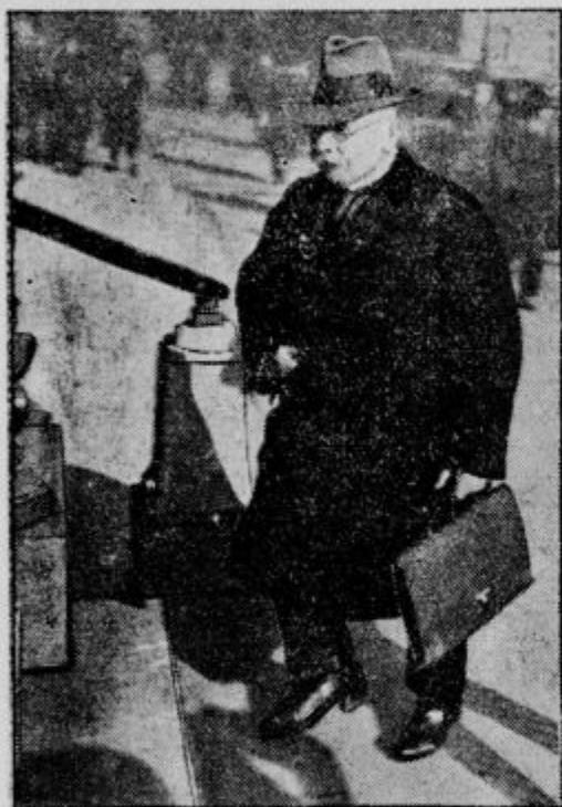
Poslanec Hugenberg, voditelj desničarske opozicije, na potu v poslopje državnega zbora.