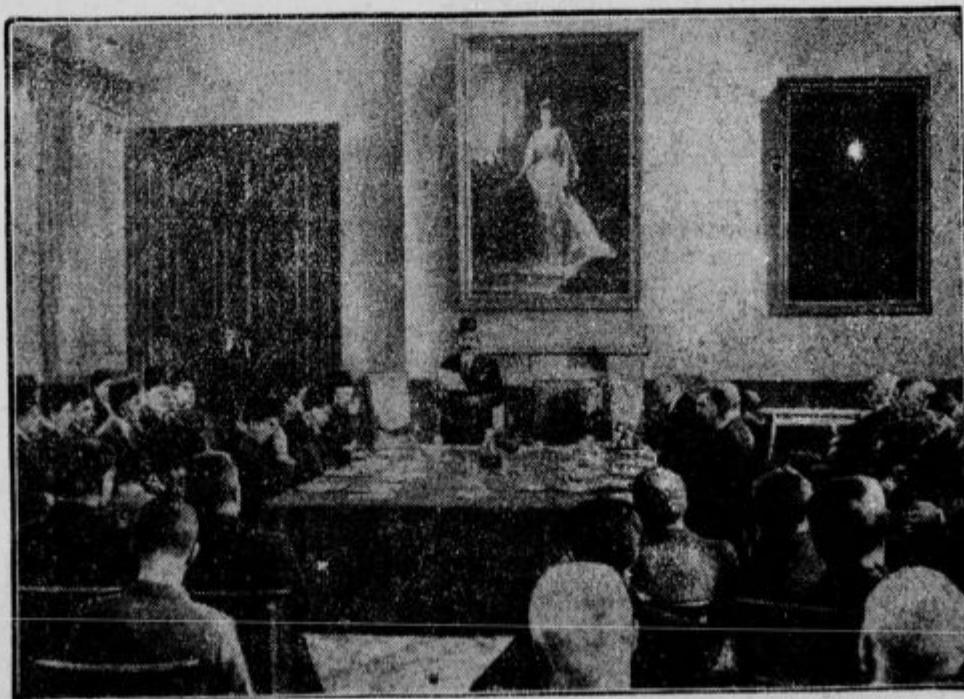
Otvoritev angleško-egiptovske konference v Londonu dne 31. marca.

Poljski listi pišejo o smrti gospe Ane Kreisar, ki je nedavno umrla v 129. letu starosti. Pokojnica je bila po vsej Poljski dobro poznana osebnost in to radi tega, ker je bila edina še živeča oseba, ki se je lahko pohvalila, da je videla francoskega cesarja Napoleona I. Na to je bila zelo ponosna in je zelo rada pripovedovala o onem dnevu 1812., ko je videla Napoleona. S svojimi stariši je bila v neki vasi nedaleč od mesta Rige in je gledala pohod Napoleonove vojske proti Moskvi. Njeni sorodniki so ji pokazali kočijo, v kateri je sedel Napoleon, in ta slika ji je ostala globoko v spominu. »Velika in težka cesarjeva kočija,« je rada pripovedovala starka, »je šla mimo zelo počasi in jaz sem zelo dobro videla cesarja, kako je sedel in se z neko visoko osebo razgovarjal. Na sebi je imel debel kožuh in na glavi je imel oni veliki črni klobuk, ki ga ima skoro na vseh svojih fotografijah.«