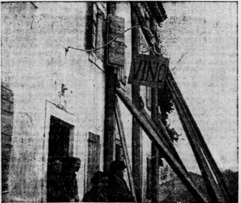
Na levi: Ena izmed porušenih hiš na Benetškem — V sredi: Prebivalci prizadetih krajev taborijo v šatorih — Na desni: Razmajane hiše se morali podpreči s tramovi