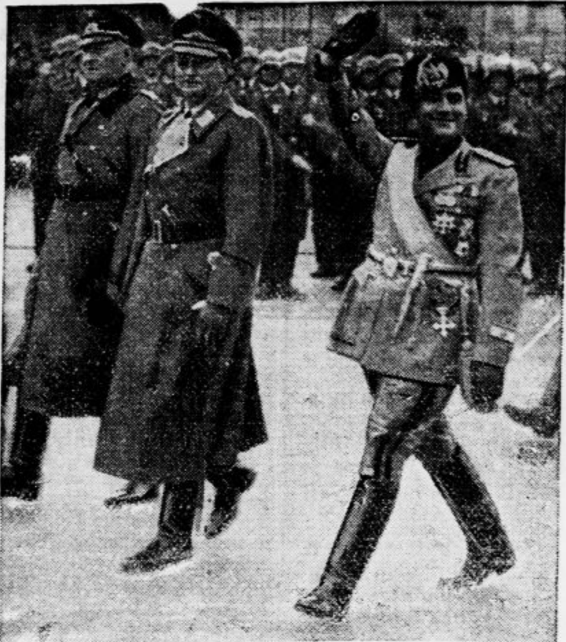
Grof Ciano pozdravlja v Berlinu nemško vojsko z dvignjeno roko