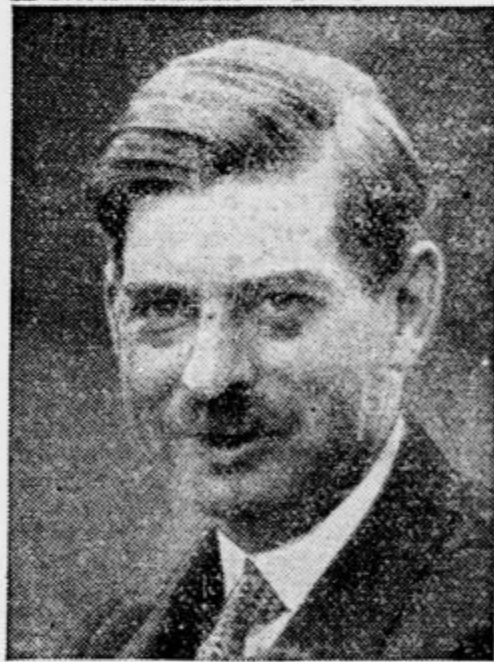
Rumunski kralj Karol

Prške ulice bodo slavnostno okrašene, slike kralja Karola so že v mnogih izložbah. Lastniški hiš in lokalov na cestah, po katerih se bo pomikal slavnostni sprevod, imajo strog nalog, da smejo na balkone in okna pustiti samo osebe, ki so jim osebno dobro znane.