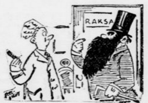
»Obrifite me popolnoma gladko, zakaj odkar mi rase brada, si nisem več na jasnem o svoji podobici.