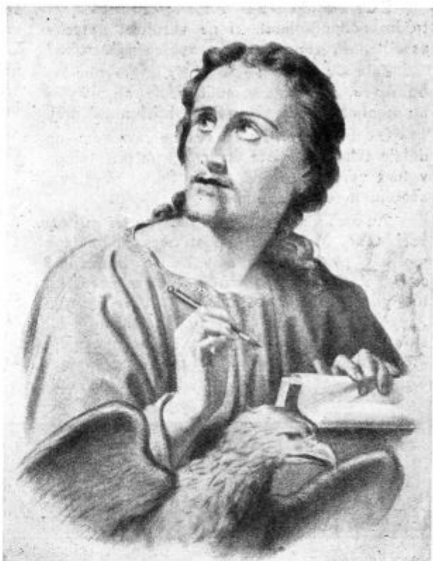
Sv. Janez Evangelist. (God 27. dec.)