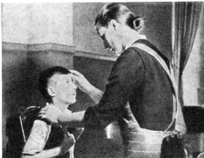
Blagoslov pred šolo.

V Ljubljani vabimo mladino osnovnih in srednjih šol na skupno praznovanje in božičevanje na detinstveni dan, t. j. 28. decembra