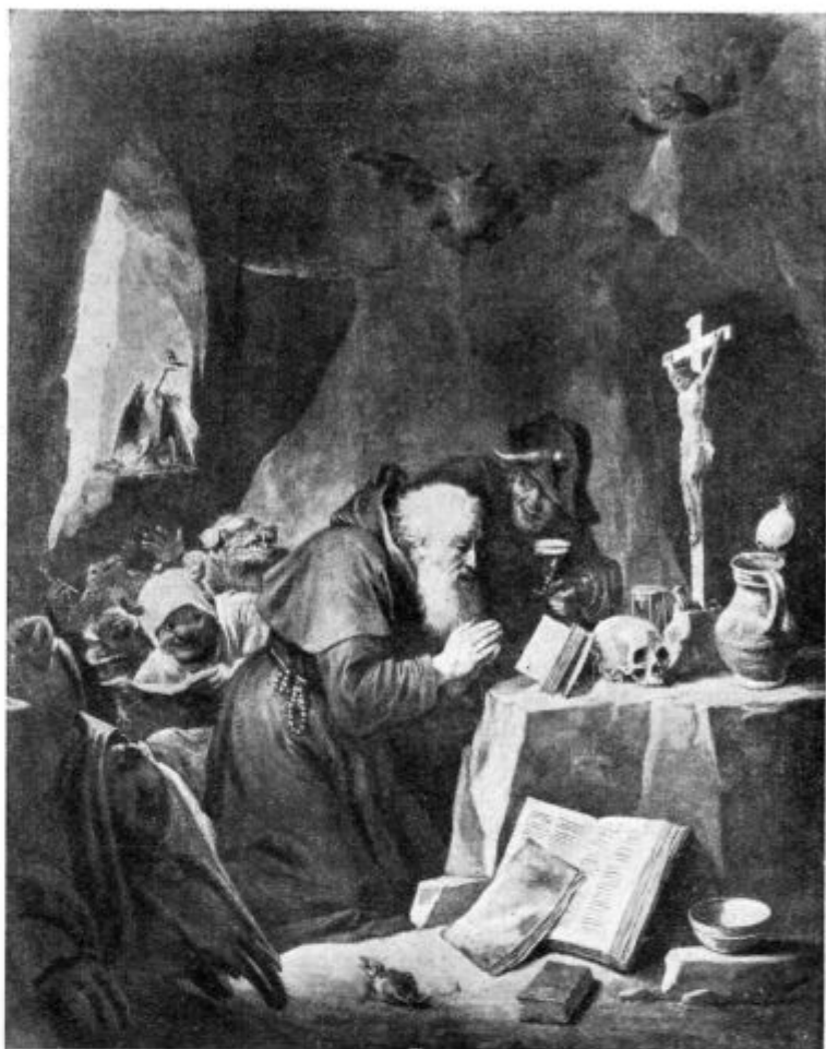
Skušanje sv. Antona Pušcavnika.

Med tem, ko je komunizem za to, da se vpelje komunistično gospodarstvo, pa dela boljševizem bolj za to, da se uniči krščanstvo in krščanska kultura in da se vpelje brezboštvo.