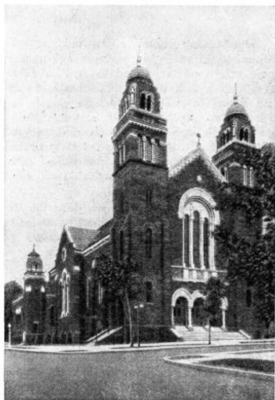
Nova marketska stolnica.

O fantovskih Marijinih družbah v Svici smo brali, kako marljivo širijo časnike. Ne mirujejo prej, dokler slabih, protiverskih in umazanih časopisov iz fare ne iztrebijo in dokler dobrih listov ne spravijo v družine.