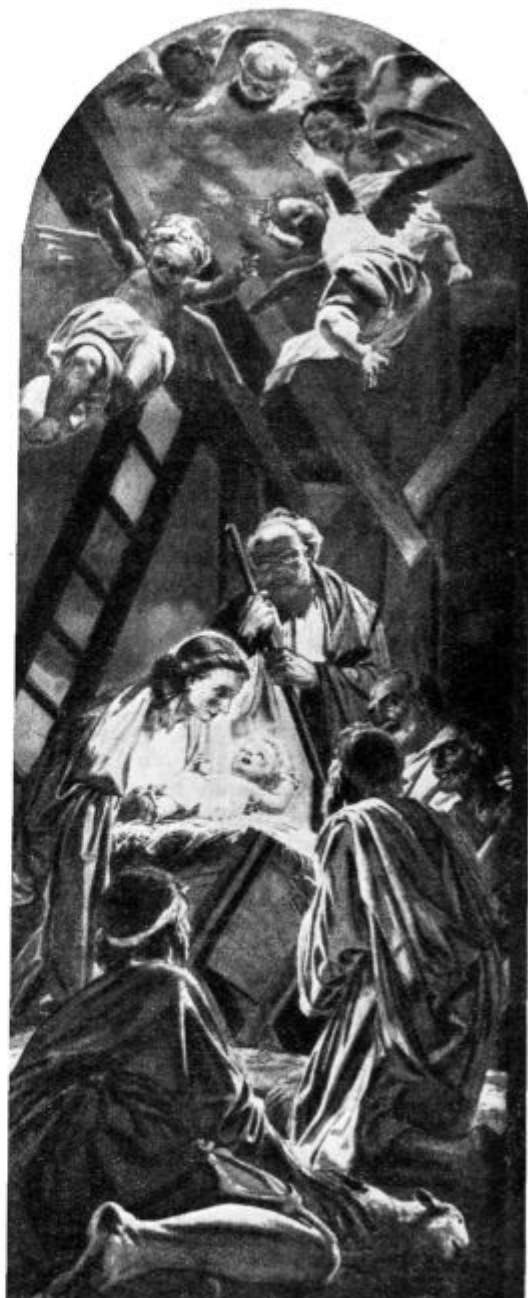
Rojstvo Gospodovo. (Fresko-slika v domžalski cerkvi.)

Zadeva je v tiru. Med ameriškimi Slovenci je ustanovljena »Baragova zveza«, ki je nje naloga, da z molitvijo, z denarnimi