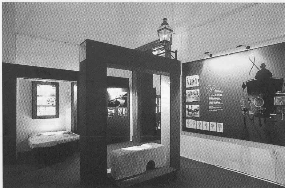
Shematični tabelarni prikaz praznovanj v zvezi z lučjo, v drugi dvorani.