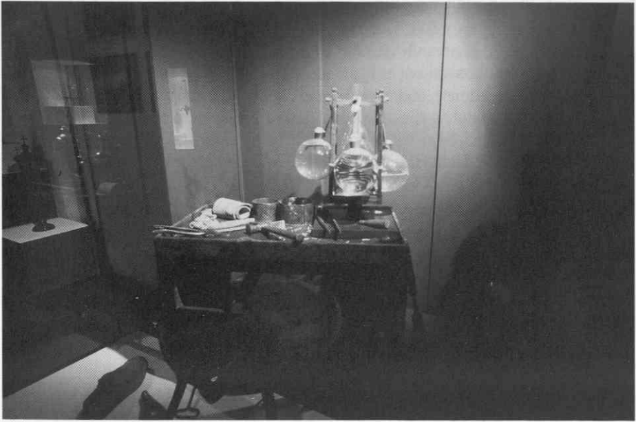
“Šuštarska luč” v okolju čevljarke delavnice.

njihovega preoblikovanja za današnjo rabo. Svetlobo in temo osvetli z 184 svetlobnimi telesi, ki jih razvrsti zelo premišljeno po funkciji in tipologiji, glede na gorivo kot primarni kriterij. Časovni vidik izrazi na simbolni ravni že v prvi dvorani, kjer izpostavi čelešnik na eni in žarnico pred ogledalom na drugi strani razstavnega prostora. Na ta način postavi nasproti sodobni električni razsvetljavi enega od najstarejših razstavljenih predmetov. Srednjeveški čelešnik ne vzbuja pozornosti le zaradi svoje starosti, temveč tudi zaradi antropomorfne oblike in dejstva, da je razstavljen prvič v svoji domovini.