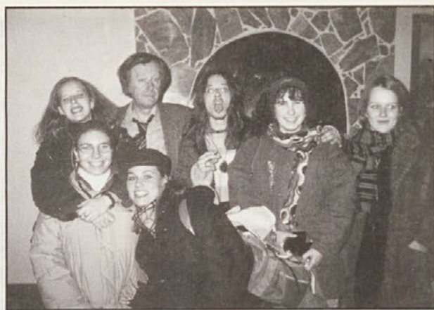
Lodž, 22. 11. 1995, Tropic bar.

Nato smo zašli v bolj industrijske sfere. Tu gre za namig na panoramski ogled velike tekstilne tovarne, ki je bila nekdaj v lasti judovskega mogotca Poznańskega in je danes spremenjena v muzej. Sledilo je romantično-avanturistično prebijanje skozi džunglo judovskega pokopališča, ki je baje največje v