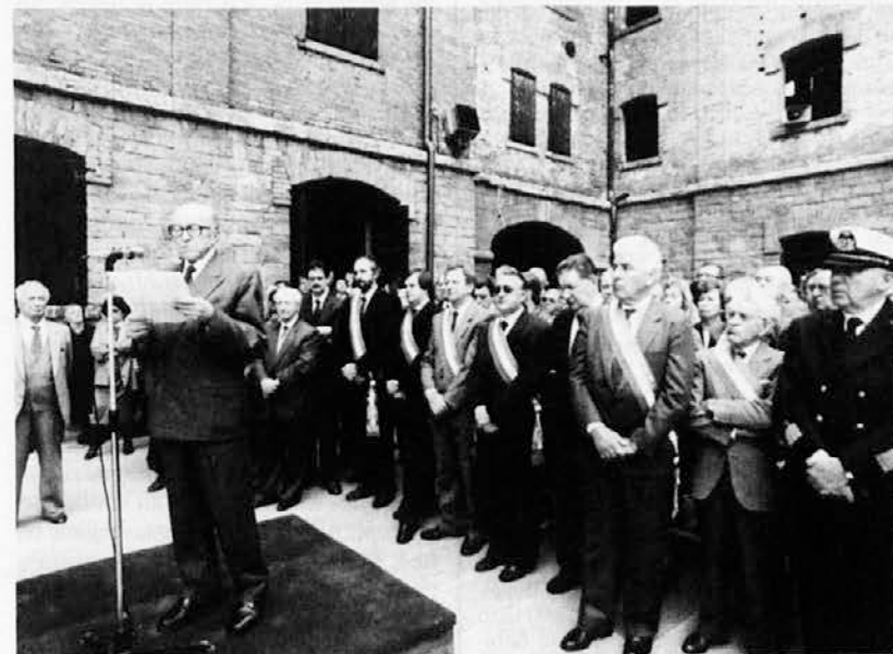
Prof. Boris Pahor med svojim govorom na nedeljski svečanosti v Rižarni