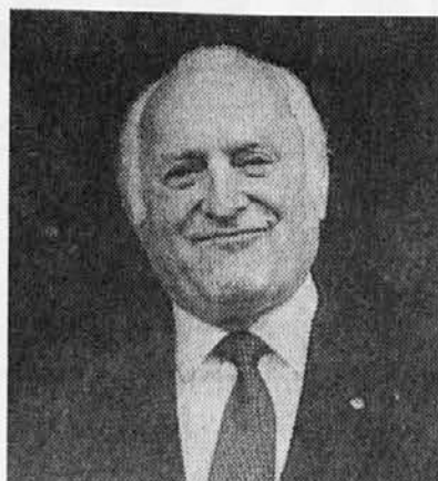
Oscar Luigi Scalfaro

Slovenska skupnost je z brzojavkama čestitala obema novima predsednikoma zbornic italijanskega parlamenta — predsedniku senata G. Spadoliniju in predsedniku poslanske zbornice O. L. Scalfaru. Izrekla jima je voščilo za uspešno delo, pri tem pa opozorila na dejstvo, da sta med bistvenimi obveznostmi, ki bi jih morala izpolniti nova zakonodajna doba, tudi odobritev pravičnega zaščitnega zakona za slovensko manjšino in pa zajamčeno avtonomno zastopstvo manjšin v okviru načrtovane volilne reforme.