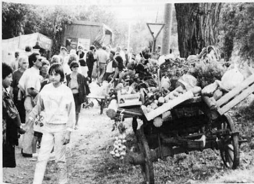
Posnetek s priljubljenega sejma kmetijskih pridelkov v Gročani, ki ga prireja domače društvo »Krasno polje«

V Gročani, vasi ob meji na tržaškem Krasu, je začelo pred približno sedmimi leti delovati domače društvo »Krasno polje«. Nastalo je na pobudo samih vaščanov, ki so začutili potrebo po bolj organiziranem kulturnem delovanju. Uradni dokument o ustanovitvi društva je bil podpisan septembra predlanskega leta; SKD »Krasno polje« pa je začelo s svojo dejavnostjo vsaj kakih pet let prej.