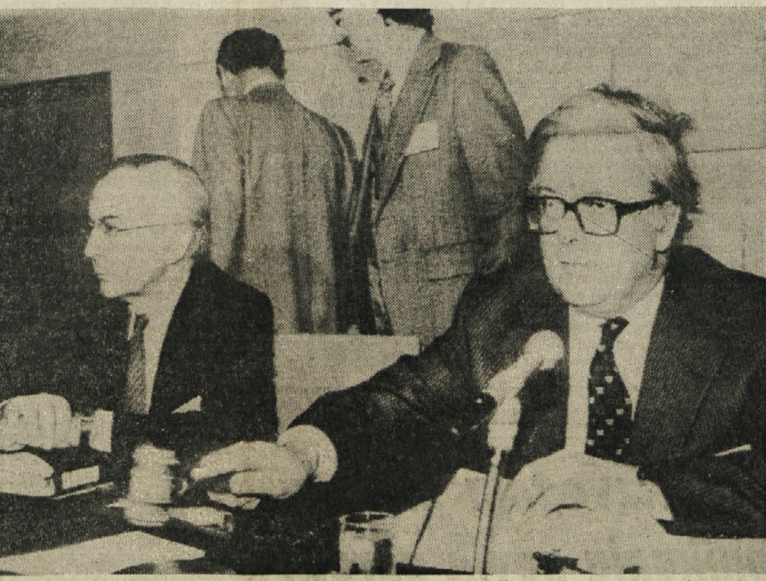
Predsednik interinalnega odbora MDS Howe (desno) in direktor sklada de Larosiere (levo) ob otvoritvi zasedanja.