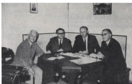
Člani uredniškega odbora v prostorih Svobodne Slovenije ob redni tedenski seji.