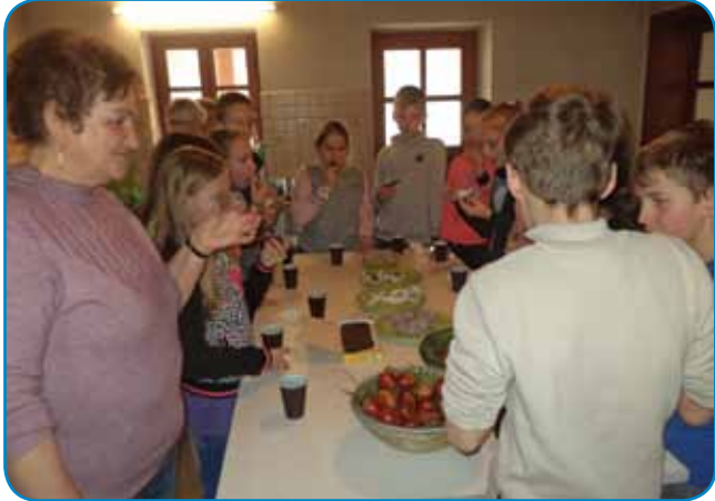
Pri farbanji djajc so nücali samo naravne materiale

nirano, gda ne mautijo njihvo včenjé pa nej počitnic. Že 15. decembra smo vküper pekli pa kinčali medene figice v Hiši jabolk na Seniki. Kak če bi se vsikdar poznali! Bili so flajnsni, baratšagoški, karažni, delali so z dobre vaule s svojima domanjima lerencama vred, pos-