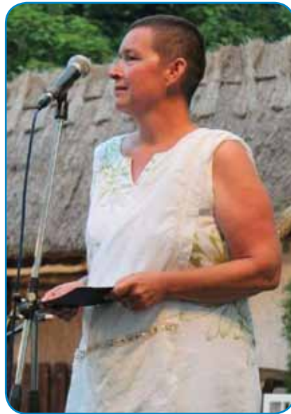
Simona na odri böltinskega folklorne festivala

igralce, steri so meli menše vloge. Takši je bilou pri tom filmi trno dosta, okauli sedemsto: »Dva mejseca smo intenzivno snemali film v Prekmurji. Meli smo bus,