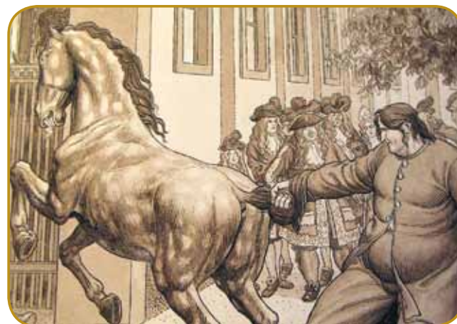
Martin Krpan je biu tak krepek, ka je leko konja za röp vöpotegno (Kejpa Hinka Smrekarja)

moralno situacijo vu vesi. Ne smejmo nimo eške dvej pisatelov toga cajta: Janez Trdina je na fundamentaj ljudske literature stvauro slovensko umetno pripovejst. Doj je spiso ljudsko blago, v tom pogledi má njegov delo velko narodopisno vrejdnost. Gda pa je pripovejsti prejkspišüvo, je največ dosejno te, gda je nej svoji liberalni ali nacionalni idej cujdejo. Tak se štejejo za njegov najbavkušá dela pripovejsti v deli »Bajke in povesti o Gorjancih«. Fran Erjavec sliši v generacijo pripovejdnikov, štera je