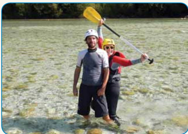
ŠPILANJE JE KAK VIRUS stran 6