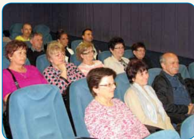
SLOVENSKI FILMSKI DNEVI - ŽE DRUGIČ stran 7