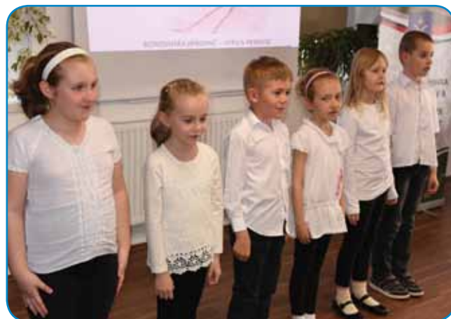
Šaularge prvoga klasa iz Števanovec so gučali pravlico Stara baba, stari ded

Tretji sourednik knjig, slovenist ino novinar Dušan Mukič , je pripovejdo o tem, kak je leta 2014 začno z digitalne kopije magnetofonski trakov prejkspišüvati pravlice, te pa eške drüge pripovejsti. Tau je - z vekšimi pavzami - trpelo več lejt,