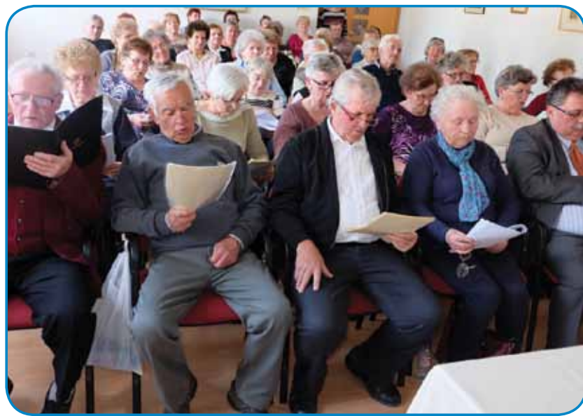
Dvorana je bila puna z najgir lidami, od šteri je kauli petnajset spejvalo, eške takši tö, šteri so se v mlajši lejtaj za tau nej podali

slüšati, ka našo starejšo lüstvo v Porabji takši glas má pa tak vej spejvati. Eške bole moremo povaliti tiste tri moške, šteri so pesmarcam cujstanili pa jim s svojim baritonom po-