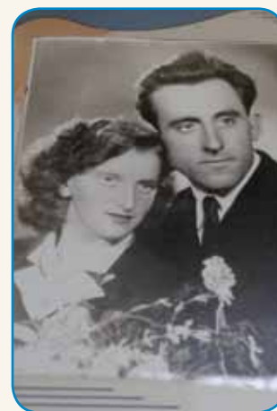
ČE JE DEŽ UŠO... stran 8