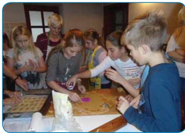
Mlajši, leko so tau pojbičke ali deklične, radi pečejo

løjšali so nas, tøj pa taum kaj odgovardjali tü. Tau je velko, ka smo se porazmeli, nej smo čüli „nem értem/ne razumem. Že tau hvali vse té mlajše! Pa tau tü trbej vedeti, ka so mlajši nej samo iz vesi. Letos smo je pa pozvali v vüzemsko delavnico zadjen den šaule, 28. marciusa, aj njim počitnice ne vzememo