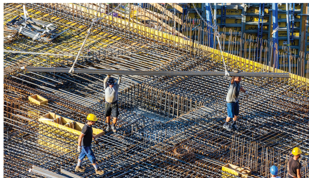
V Avstriji delavci v najnižje plačanih poklicih zaslužijo neke med 1.500 in 1.800 evri neto na mesec.