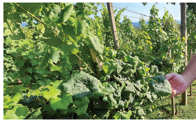
Eden prvih znakov pojava zlate trsne rumenice v vinogradu je nagubanost listov vinske trte.

»V posameznih vinogradih v žariščih okužbe iz letošnjega in prejšnjih let so deleži okuženih trsov od nekaj pa do več kot 50 odstotkov. Celoten vinograd mora biti izkrcen v primeru, ko je v njem 20 odstotkov ali več trsov, ki kažejo bolezenska znamenja zlate trsne rumenice. Takih je 19 vinogradov na območju Spodnjega Podravja. V primeru, ko fitosanitarni inšpektor odredi uničenje trte z bolezenskimi znamenji v vinogradih v žariščih okužbe, so vinogradniki upravičeni do odškodnine v skladu z zakonom o zdravstvenem varstvu rastlin,