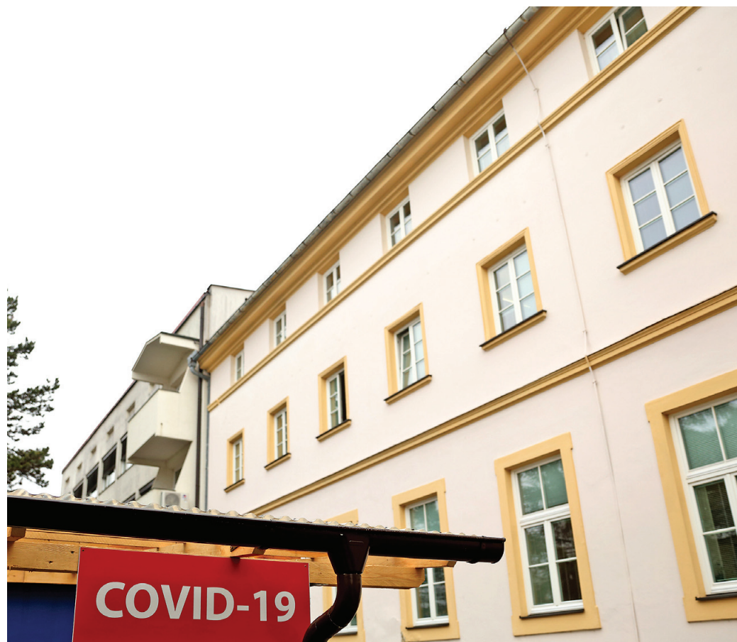
V ptujski bolnišnici ustavljajo nenujne operacije.

O tem, na katerih področjih dela se vzpostavitev kovid oddelka in kovid intenzivne dejavnosti najbolj pozna, je direktorica SB Ptuj Anica Užmah povedala: „Z vzpostavitvijo kovid oddelka je oddelke neakutne zdravstvene nege (podaljšano bolnišnično zdravljenje in paliativa) zmanjšan na četrtno, posledično pa je tudi kirurgija zmanjšana za tretjino. Kovid dejavnost je namreč lokacijsko na oddelku poboljšaničnega zdravljenja, neodpušljivi bolniki s tega oddelka pa so bili preseljeni na kirurški oddelke. S povečanjem kapacitet kovid – konec oktobra smo ga s 15 povečali na 25 postelj – in z vdori kovid v bolnišnico smo že zmanjšali nenuj-