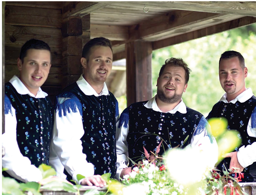
Ansambel Slovenski pjebi

načrte z nastopi na festivalih narodno-zabavne glasbe. V letu 2022 želijo nastopiti vsaj na treh, glasbo že pripravljajo. Tudi najstarejši festival narodno-zabavne je med njimi. Čeprav je konkurenca na narodno-zabavni sceni velika, so Slovenski pjebi prepričani, da tudi v tej konkurenci lahko pridejo do izraza, če se posvetijo temu, kar manjka. Sami so se našli v štiriglasnem petju. Sploh pa se glasbi v zadnjem času predajajo skoraj v celoti, tako da jim na nek način že zmanjkuje časa za službe. Vsaka njihova skladba, polka ali valček, ima svoj pomen, nič ne prepuščajo naključju, ker če nekaj pove, ima neko sporočilo, bo našla tudi pot do poslušalcev, ljubiteljev narodno-zabavne glasbe. Na nastopih so vedno oblečeni v narodno nošo, tudi s tem izražajo svoj odnos do narodno-zabavne glasbe in vsega, kar želijo skozi svojo glasbo povedati ljudem. Sicer pa igrajo tudi druge zvrsti glasbe.