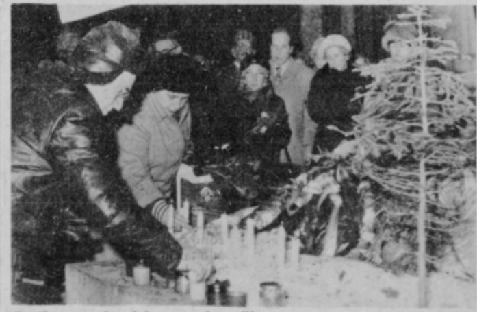
Sveče so zaplapolale v spomin padlim