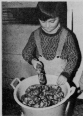
Tole največjo mi bo mamica skuhala za rojstni dan.