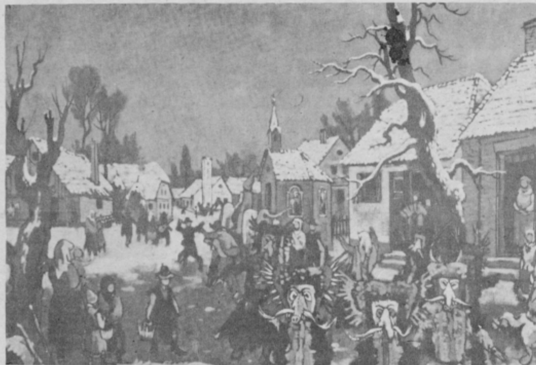
France Mihelič: Kurentovanje v snegu, olje, 1939-75