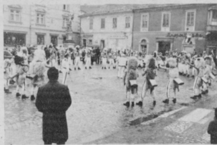
Tudi zvončarji z Reke so bili že gostje ptujskega kurentovanja

V kratkem bodo predstavniki komisije za karneval in tudi komisije za sodelovanje s šolami obiskali delovne organizacije, pa tudi šole ter se dogovorili za oblike sodelovanja na osrednji turistični prireditvi v občini. Po prvih vesteh bo združeno delo občine na prireditvi sodelovalo z okrog 25 skupinami. MG