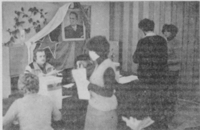
Zbora in glasovanja se je udeležilo 85 odstotkov članov kolektiva