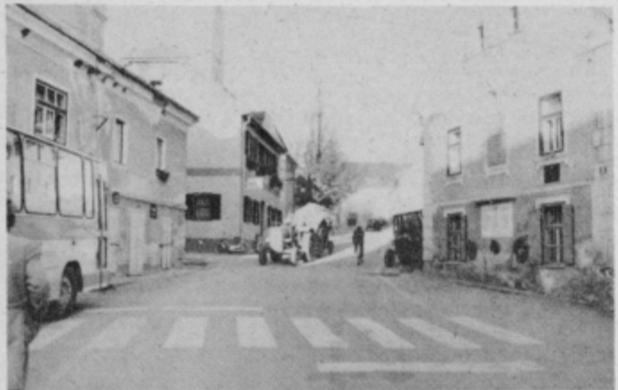
Zimska podoba središča KS Makole

Želite posodobiti svoje gospodinjstvo, svoj dom?