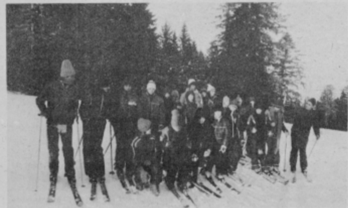
Pouk tudi v času počitnic. Tokrat se mladi pionirji iz občine Svetožarevo učijo smučarskih umetnosti pri Treh kraljih na Pohorju.

Desetdnevno letovanje je pionirjem nagrada za izredne učne uspehe v preteklem obdobju, izkoristili pa ga bodo za navezovanje novih prijateljskih stikov z vrstniki iz bistriške občine, spoznanju nekaterih znamenitosti občine gostiteljice, predvsem pa se bodo seznanjali s smučarskimi veščinami, saj imajo pri Treh kraljih organizirani smučarski tečaj.