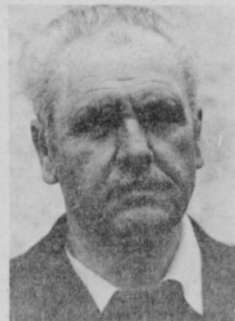
... in danes, kot predsednik krajevnega odbora ZZB NOV v Rogoznici.

štavec iz Cirkove. On mi je dejansko pomagal organizirati pobeg. V sami V. prekomorski brigadi pa je bilo Ptujčanov po podatkih prek 120, vseh imen pa se ne spominjam. So pa lepo napisana v knjigi o tej brigadi.“ Kdaj ste z brigado prišli v Jugoslavijo? „Uradno je po podatkih bila V. prekomorska brigada formirana 23. decembra 1944 v Splitu. Dejansko pa so bili bataljoni formirani že prej v Angliji. No, ta naša brigada je imela štiri