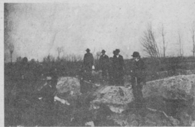
Izkopavanja S. Jennyja leta 1893 na Zgornjem Bregu.