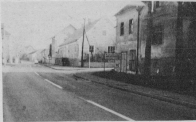
Zdravstveni dom v Ormožu je tako dobro »zamaskiran«, da ga često zgreši tudi dobro oko avtomobilista.