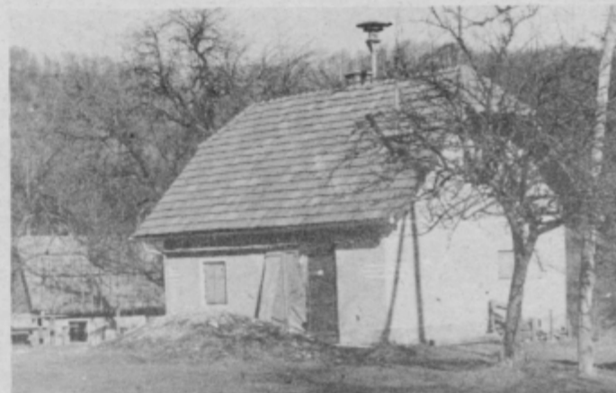
Sedajni gasilski dom v Žetalah bodo dogradili

aktivnejše delo v gasilskih vrstah. Kljub temu so poskrbeli tudi za izobraževanje članstva, lani je nekaj članov uspešno končalo tečaj za nižjega gasilskega častnika. S svojimi desetimi se udeležujejo gasilskih tekmovanj. Resno delo na tem področju je že rodilo prve