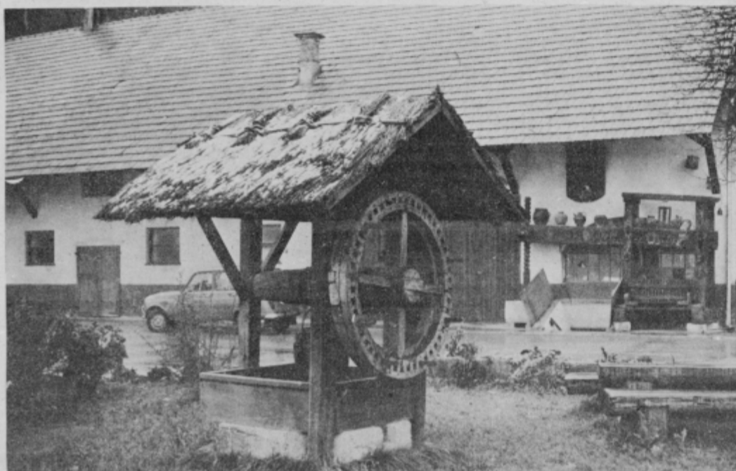
Pogled na dvorišče Toplakove domačije v Mostju.

Brez dvoma je študija dobra osnova s potrebnimi dopolnitvami za nadaljnji turistični razvoj. Pri tem se moramo zavedati, da bo turizem tudi v bodoče ena izmed zelo pomembnih gospodarskih panog. MG