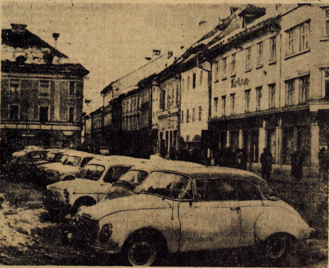
V Kranju je precej parkirnih prostorov, vendar so v glavnem manjši in hitro napolnjeni. To velja že za sedanji — zimski čas, v ostalih obdobjih je stiska za prostor še posebno velika. Morda bo letos dokončno urejen za te namene tudi prostor ob novem kokrškem mostu. Na sliki: parkirani avtomobili na Titovem trgu.

Nadaljnje razprave o razvoju krajevne samouprave bodo verjetno še jasneje oblikovale mesto teh organov. To lahko pričakujemo v sedanjih razpravah o družbenem planu in proračunu, nato v razpravah o občinskem statusu, zlasti pa v pripravah za izdelavo statutov krajevnih skupnosti, kar je še predvideno letos.