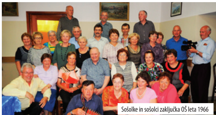
Sošolke in sošolci zaključka OŠ leta 1966