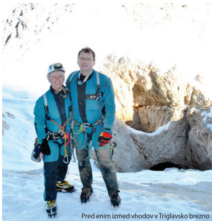
Pred enim izmed vhodov v Triglavsko brezno

Spoznala sva se januarja v Osoletovi jami, se zatem več mesecev nisva videla, oktobra pa sva šla v Habečkovo in Zadnikovo brezno na Molički planini. Kmalu sem ga povabila v gore in tako se je začelo. Tudi zdaj, ko sva poročena in imava različne delovne urnike, se zgodi, da greva v hribe