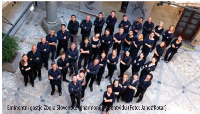
Eminentni gostje Zbora Slovenske filharmonije v Šentvidu