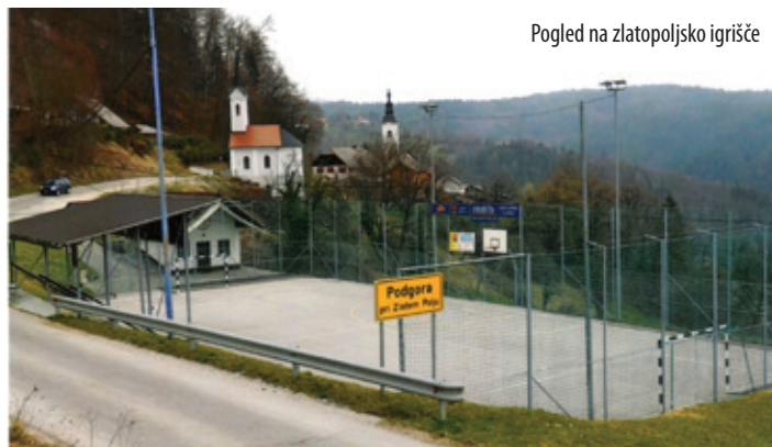
Pogled na zlatopoljsko igrišče

Nagovoril nas je tudi župan Matej Kotnik in izrazil zadovoljstvo nad de-