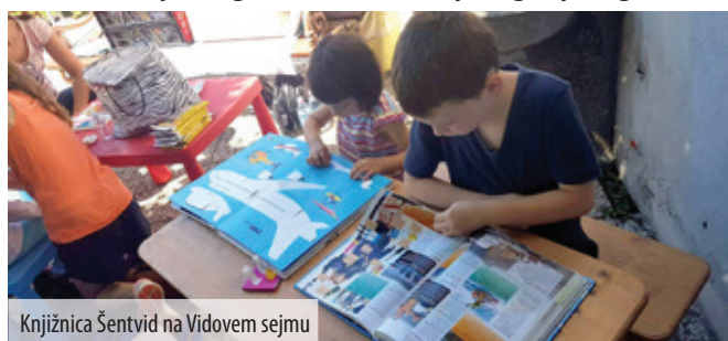
Knjižnica Šentvid na Vidovem sejmu

Krajevna knjižnica dr. Jakoba Zupana Šentvid je tudi letos sodelovala na Vidovem sejmu. Ogledate si lahko nekaj fotografij z dogodka.