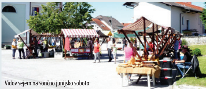
Vidov sejem na sončno junijsko soboto

Prvo soboto po godu sv. Vida, 18. junija 2016, nas je v Šentvidu pričakalo lepo sončno vreme. Člani TD Sv. Vid so že v zgodnjem jutru postavili stojnice, ki so čakale najprej ponudnike, malo pozneje pa seveda obiskovalce.