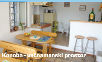
Konoba - večnamenski prostor

Cenik in fotogalerija: www.vilamirakul.com .