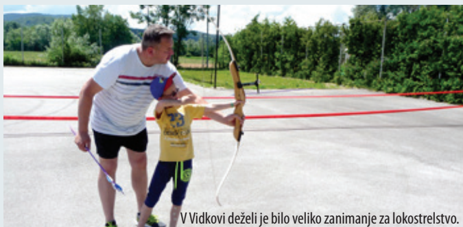
V Vidkovi deželi je bilo veliko zanimanje za lokostrelstvo.