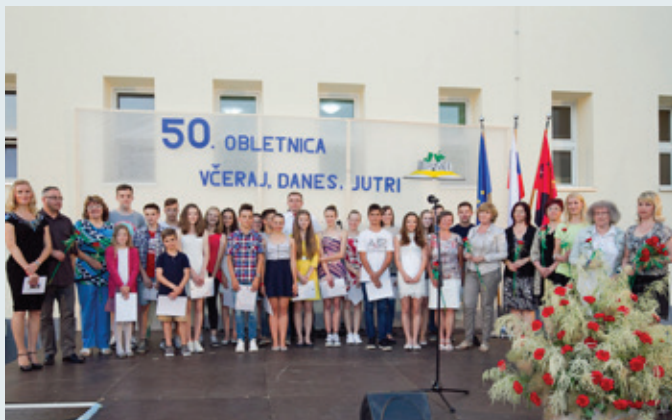
Učenci, ki so dobili pohvale za izjemne dosežke na tekmovanjih v šolskem letu 2015/2016.