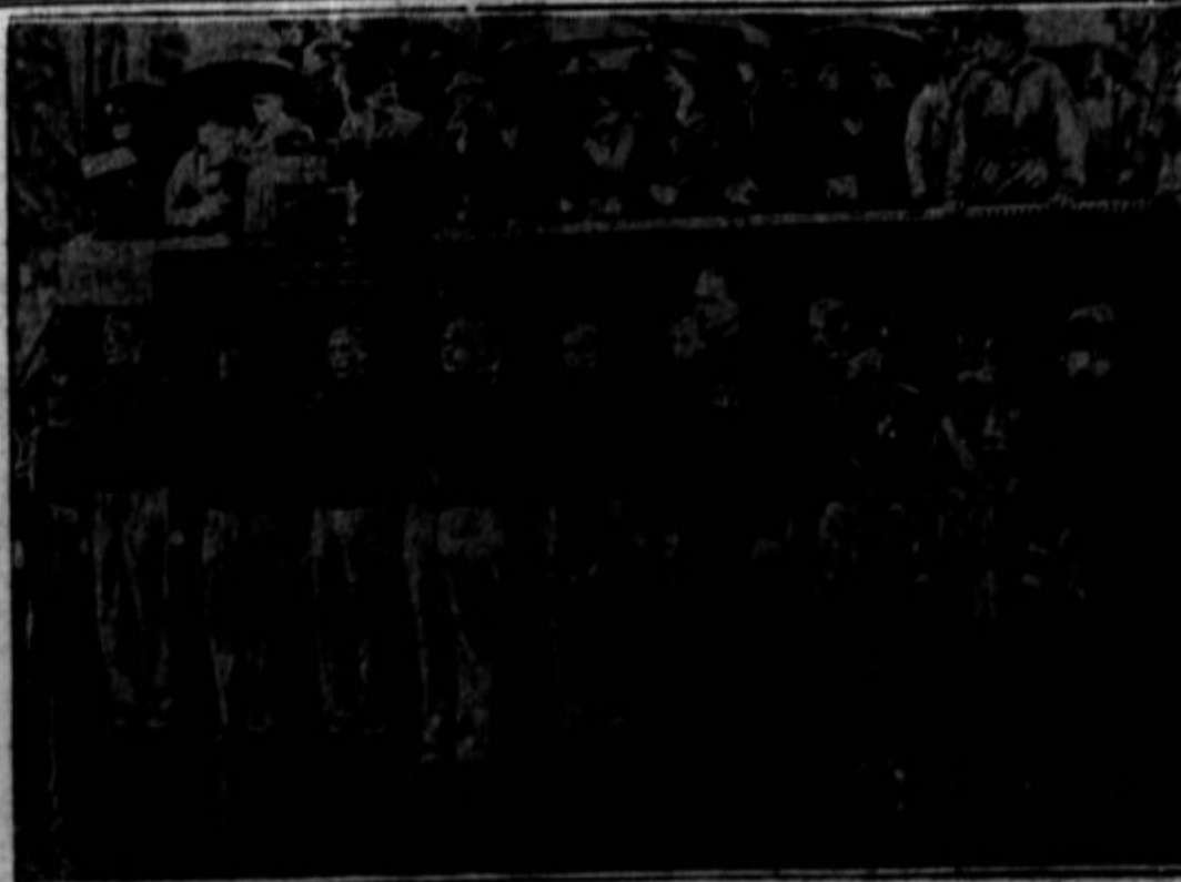
Sir Oswald Mosley (četrti od desne), bivši angleški laborit in danes vodja angleških fašistov, opazuje parado italijanskih fašistov v Rimu.

Chicago. — Zadnje nedelje je 75,000 ljudi, novi rekord, posetilo prostore svetovne razstave in si ogledalo poslopja ter nekatere znamenitosti. "Začarani otok" za mladino je bil prvič odprt in tam se je gnetlo največ ljudstva. To je bila zadnja nedelja za obisk pred odprtjem. V sredo, 17. maja, bodo prostore zaprli posetnikom in odprejo jih šele na dan oficijelne otvoritve 27. maja, ko bo glavna vstopnina 50c. Deležje sadnjih tednov je precej sadržalo priprave in mnogo paviljonov je še v konstrukciji.