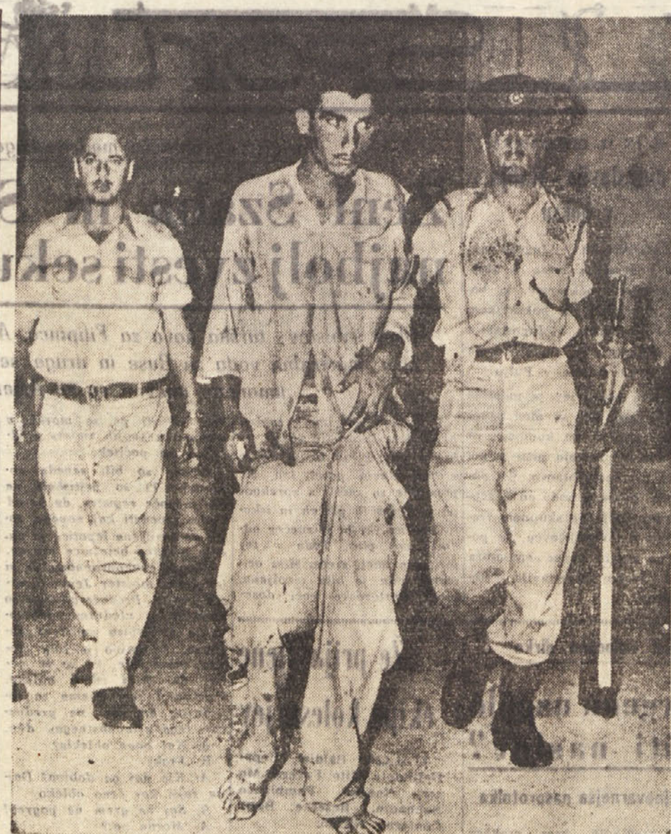
V dolini Gezret v severnem Izraelu so iz nekega taborišča pobežnili arabski jetniki. Ki so jih potem polovili. Pri begu pa je izgubilo življenje 13 jetnikov in 2 vojaka.