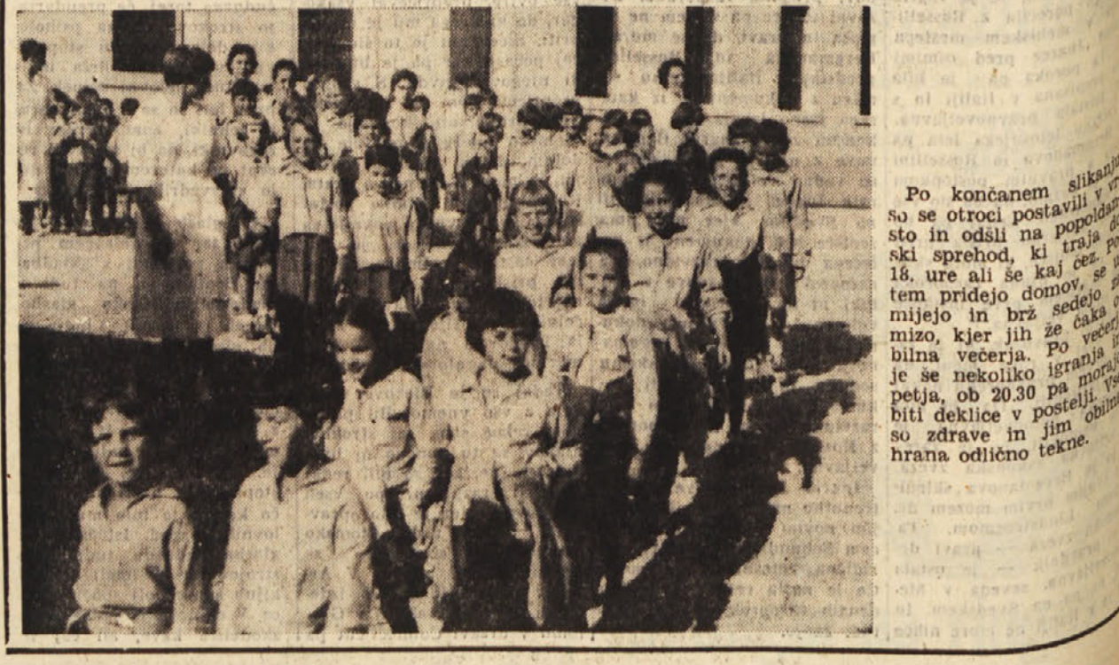
Po končanem slikanju so se otroci postavili v vrsto in odšli na popoldnevni skil sprehod, ki traja 18. ure ali še kaj čez, potem pridejo domov, se umijejo in brž sedajo na mizo, kjer jih že čaka večerja. Po večerji se se nekoliko igranja, ki je ob 20.30 pa morajo biti deklice v postelji. Vse so zdrave in jim odlična hrana odlično tekne.