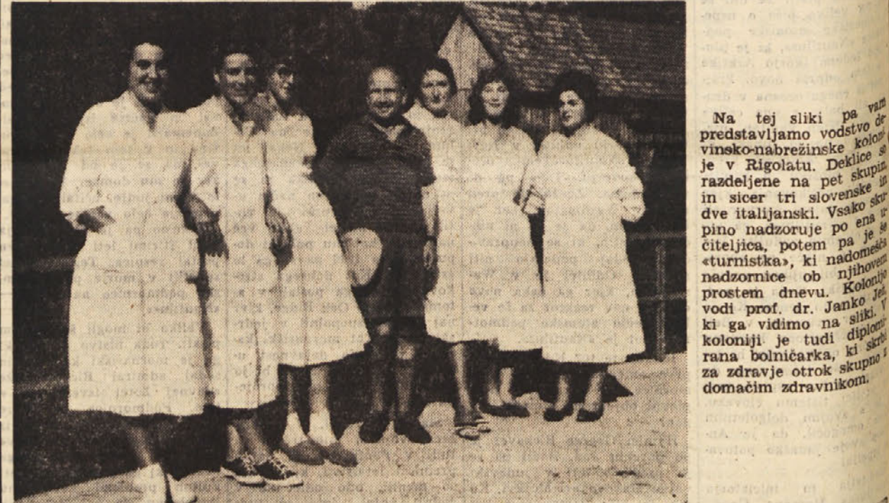
Na tej sliki predstavljamo vodstvo devinsko-nabrežinske kolonije v Rigolatu. Deklice so razdeljene na pet skupin in sicer tri slovenske in dve italijanski. Vsako skupino nadzoruje po ena učiteljica, potem pa je še »turnistka«, ki nadzoruje nadzornice ob njihovih prostem dnevu. Kolonijo vodi prof. dr. Janko ... ki ga vidimo na sliki v koloniji je tudi diplomiрана bolničarka, ki skrbi za zdravje otrok skupno s domačim zdravnikom.