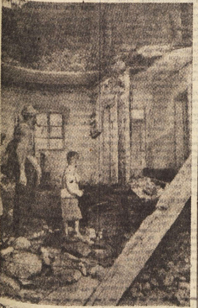
Po nesreči v dolini Venosta, kjer je plaz podrl del hise, in povzročil smrt treh oseb.