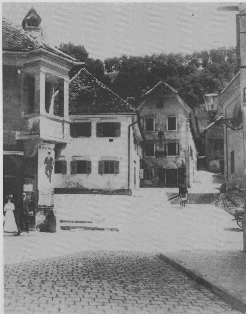
Ulica sv. Florijana