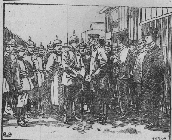
Begrüßung der griechischen Offiziere in Görlitz.