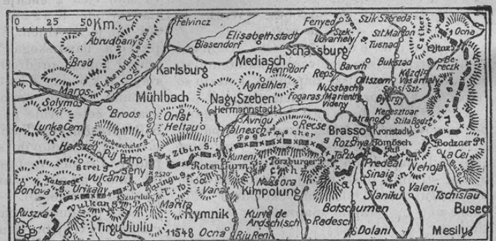
Zu den Kämpfen um Hermannstadt.

Z ozirom na uradna poročila naših generalnih štabov prinašamo zanimivi zemljevid, ki kaže prizadete kraje v Siebenbürgenu. Debeli črta (••••••••) označuje mejo. Na zemljevidu so najzanimivejša mesta Hermannstadt (madžarsko Nagy Szeben) in Kronstadt (Brasso), ki so ju nemške in avstro-ogrške čete v zmagoviti protiofenzivi zasedle. Vsa naša pokrajina Siebenbürgen bode kmalu popolnoma očiščena rumunsko-ruskih nasilnežev.