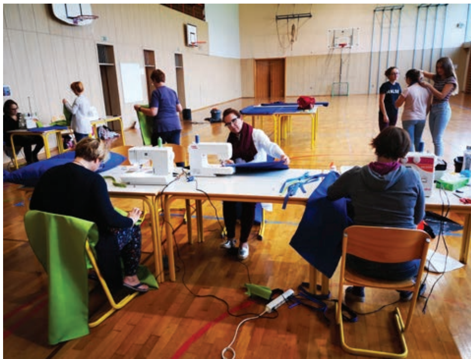
Slika 2: Pogled v šiviljsko delavnico

Javilo se je 14 fantov, da bodo pod budnim očesom mentorjev, staršev in hišnikov izdelali leseni del, 12 deklet pa se je javilo za pomoč pri izdelavi in šivanju blazin.