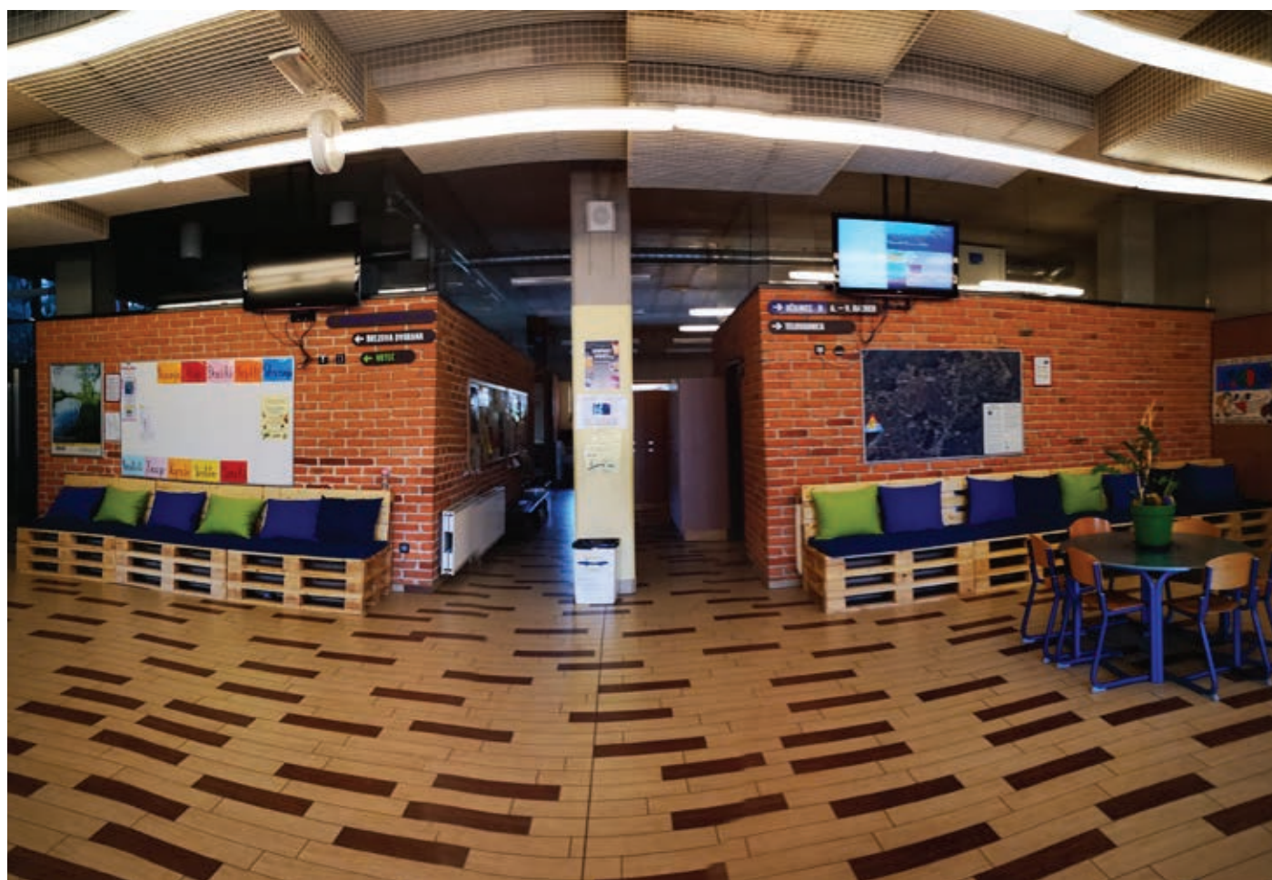
Slika 4: Kako je lepo!

Če vidiš smet na tleh, naj se s tvojo pomočjo znajde v smeteh.