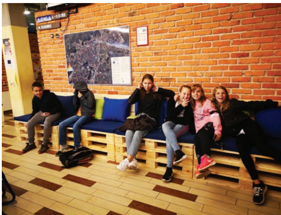
Slika 3: Pa jih imamo – svoje sedežne garniture! Super so!

Učenci, ki so sodelovali pri izdelavi sedežnih garnitur, se vedejo odgovorno kot »varuhi« svojega opravljenega dela. To potrjuje dogodek, ki mu je prisostvovala dežurna učiteljica v avli šole, kjer se nahajajo tudi šolski koticčki. Učenec ji je povedal, da je sodeloval pri izdelavi sedežnih garnitur in obnovi mize. Zgrožen ji je pokazal popisano mizo in potožil, koliko truda je vložil v obnovo mize, česar pa očitno nekateri