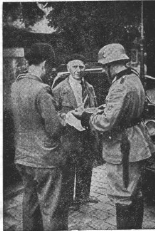
Nemški policisti pregledujejo listine francoskih beguncev, ki se vračajo v svoj rojstni kraj.

■ Izvoz bencina iz Amerike v Rusijo se bo nemoteno nadaljeval in ga ne bo ovirala nova uredba o nadzorstvu nad izvozom petroleja.