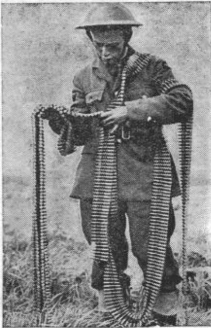
Pas smrti, ki ga jemlje s seboj letalec. V pasu so patrone za letalsko strojnico.

Baltiške države Estonka, Letonska in Litva, ki so se po nedavnih volitvah proglasile za sovjetske republike, so takoj pristopile k velikim gospodarskim in socialnim reformam. Zaradi upora proti tem reformam so bili aretirani bivši vrhovni poveljniki estonske vojske general Laidoner in bivši zunanji ministri vseh treh držav.