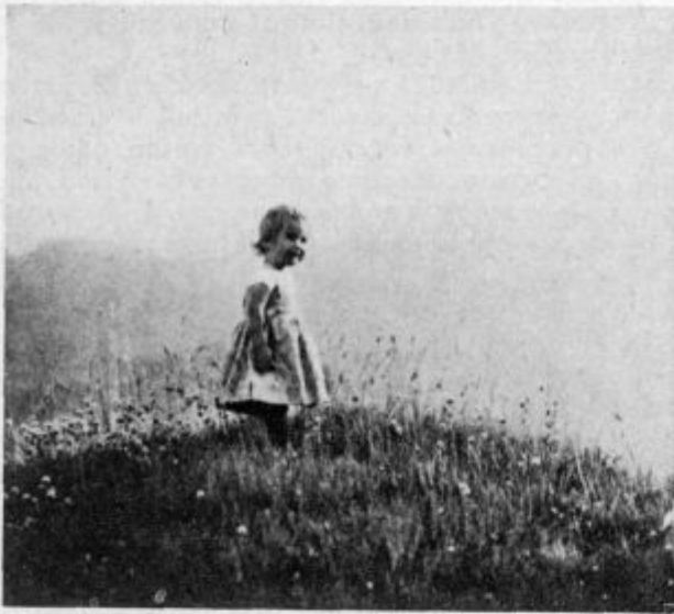
Kmalu bo v Marijinem vrtcu...

Mnogo je bilo delavcev neorganiziranih. Tedaj so rekli: »V organizaciji je moč!« In ustanovili so organizacijo, ki si je nadela nalogo: izboljšati položaj delavca. Ker si ni znala organizacija drugače pomagati, je začela s stavkami. Stavke, večje in manjše, so bile na dnevnem redu.