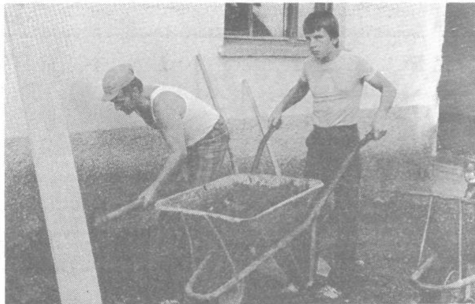
Ob novi cesti živeči prebivalci Črnega vrha bodo sami uredili bankine, odvodnjavanje in še mnoga druga opravila

Lahko rečem, da znam ceniti napor naše družbene skupnosti in krajanov, pri vodenju telefona v vas. In sedaj nova pridobitev. Asfalt.