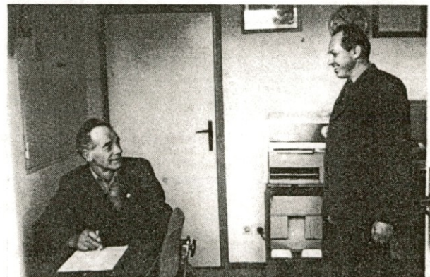
Varnostnika pri menjavi izmene