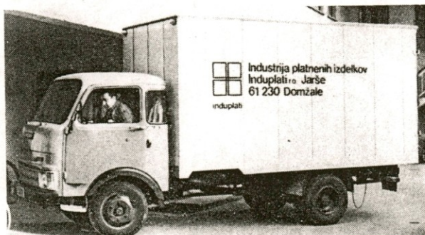
Naš novi poltovorni avto

NOVOLETNO KRIŽANKO BOMO OBJAVILI V JANUARSKI ŠTEVILKI