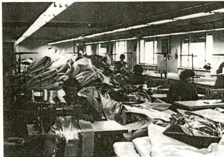
Notranjost obrata konfekcije v Mengšu