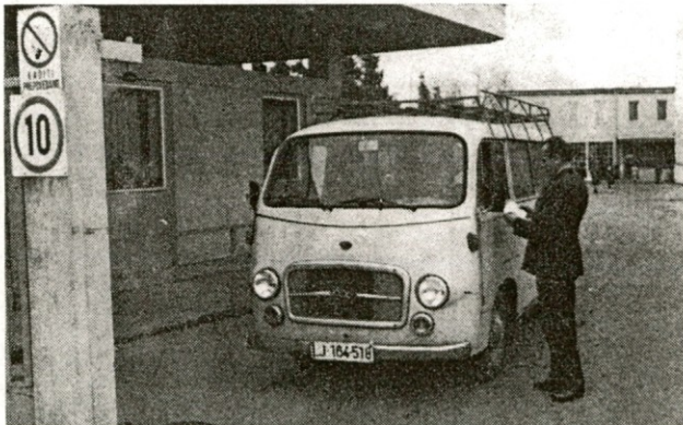
Kontrola dokumentov pri izhodu iz tovarne v Jaršah