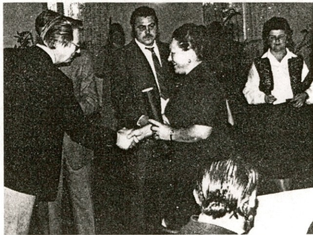
Čestitke in nasmeh naše slavljenke

smo slabše povezani med seboj kot smo bili v Jaršah. Pred vsakim sestankom smo se pogovorili, izdelali stališča in tudi poročali po končanem sestanku. Delala sem v delavskem svetu, bila sem predsednik organizacijske enote, 8 let pa sem tudi delegatka v SIS za socialno skrbstvo in v izvršnem odboru te SIS. Aktivna sem tudi v svoji krajevni skupnosti. Sedaj se sestanki prehitro »zbobnajo«, zapisniki premalo povedo, o planu smo se premalo pogovorili. Osebni stik je za obveščanje najboljši. Tega pa tudi v delegatskem sistemu ni dovolj, saj se ne moremo vedno dobiti in pregledati gradivo.