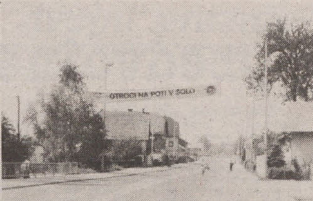
Tudi na Črnučah je transparent opozarjal voznike na previdnost.

V skladu z načrti varnih poti so izpostavljena mesta varovali pionirska prometna služba, aktivisti krajevnih skupnosti ter delavci milice. Pionirji prometniki so skrbeli za varnost učencev v neposredni bližini šol, nadzirali promet učencev kolesarjev ter skrbeli za tehnično brez-