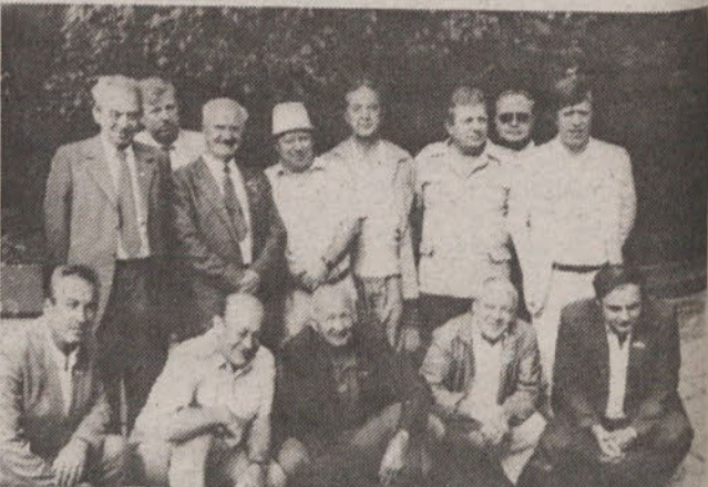
REZERVNI VOJAŠKI STAREŠINE