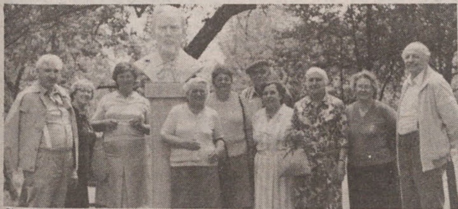
Skupina izletnikov pred spomenikom Josipa Jurčiča na Muljavi.