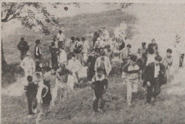
Učenci 1. letnika so se urno povzpeli k alpskemu botaničnemu vrtu Juliana v Trenti.

Razmišlja tudi o ustanovitvi komisije prodaje starih vozil, pa tudi novih avtomobilov, zelo spretno pa se je vključil v prodajo »neuvrščene« golfove, ki so jih imeli v Beogradu organizatorji vrha neuvrščene. V enem tednu je prodal 25 golfov diesel (4 vrata), ki so imeli prevoznih komaj 1000 kilometrov, lastniki pa so za njih odšteli 201 milijon dinarjev in prometni davek. IVAN ŠUČUR