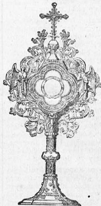
Prevzame vsokcvrstna dela iz kovine.

Priporoča svojo novo moderno delavnico. — Izdeluje cerkvene posode, orodja in lence. — Se toplo priporoča pred. duhovščini in cerkvenim oskrbništvom za izdelovanje bodisi novih ali pa popravo starih posod. Delo solidno in kolikor je mogoče, po nizki ceni. — Po srebrni, poslani tudi na ognju. Obrisi so na razpolago.