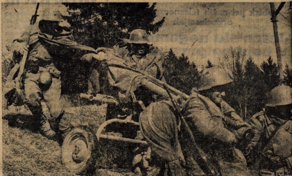
Blato, dež, sneg in izredno težki terenski pogoji so bili velika preizkušnja za enote JLA, teritorialno obrambo in civilno zaščito. Po končanih vajah pa smo na obrazih vseh opazili sicer utrujen, vendar zadovoljen nasmeh.