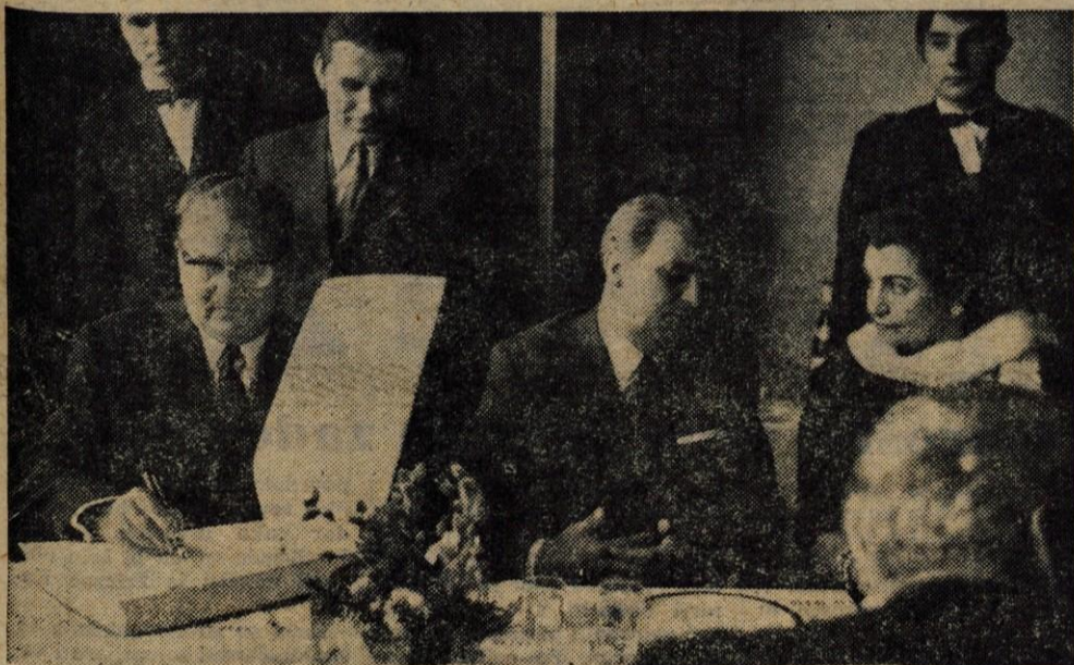
V nedeljo je predsednik Tito obiskal Golf hotel na Bledu.

List izhaja od oktobra 1947 kot tednik. Od 1. januarja 1958 kot poltednik. Od 1. januarja 1960 trikrat tedensko. Od 1. januarja 1964 kot poltednik, in sicer ob sredah in sobotah