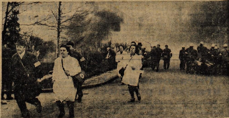
Letala so napadla tovarno Titan v Kamniku. Enote civilne zaščite so takoj stopile v akcijo in uspešno prestale preizkušnjo. — Na sliki: reševalna ekipa in gasilci iz Titana