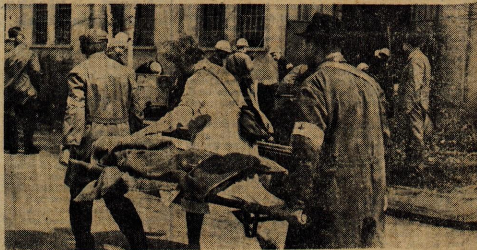
V Titanu je po bombnem napadu izbruhnil požar, »porušena« je bil del tovarne, bilo pa je tudi nekaj »ranjencev«.