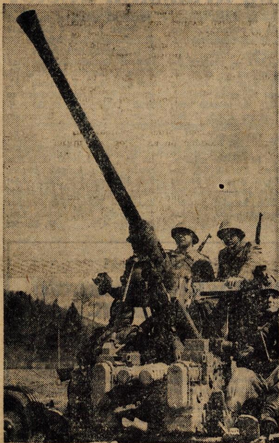
Na vajah so sodelovale enote z vsemi vrstami orožja. Pomembno vlogo je v tej »vojni« odigrala tudi protivzračna obramba. — Na sliki: protivzračni top v akciji

Pravzaprav bi lahko rekli, da je bila to prava vojna, v kateri so sodelovale vojaške enote ljubljanskega armadnega področja, enote teritorialne obrambe in civilne zaščite ter prebivalci. Razlika je bila le v tem, da so mrtve in ranjene v njej določali »sodniki«, ki so spremljali vsako enoto.