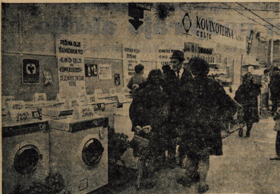
Obiskovalci so se na sejmju zelo zanimali za gospodinjske stroje.