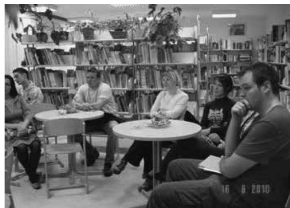
Slika 1: Starše družinsko branje zanima.

Zelo pomemben vezni člen za spodbujanje družinskega branja in sodelovanja staršev s šolo je tudi šolska knjižnica. V njej že več let pripravljamo različne projekte, ki spodbujajo in motivirajo k branju tako učence kot tudi njihove starše.