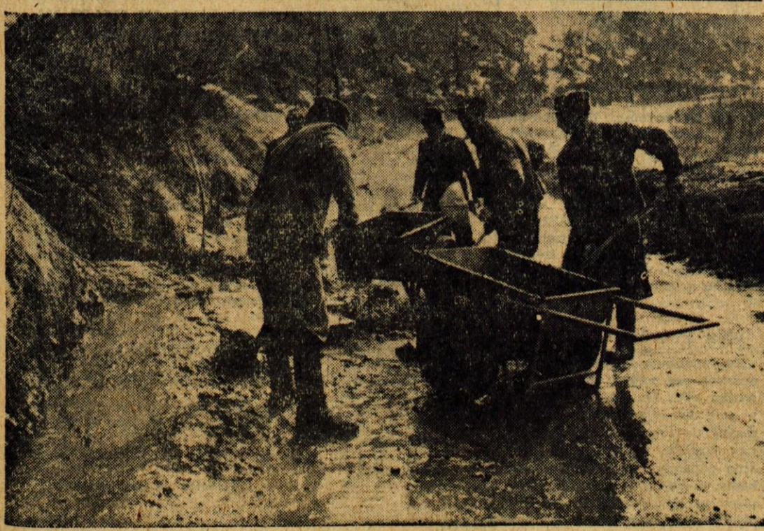
Pred dnevi je v Zmencu zdrsel na cesto plaz