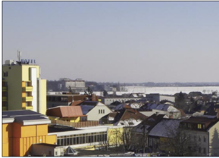
Murska Sobota in okolica

V programu so zapisane tri primerjalne razvojne prednosti tega dela Slovenije, in