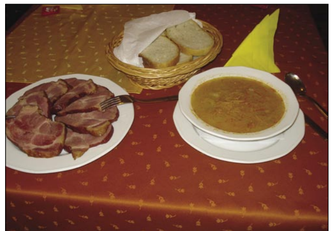
Za fašenek se mora mastno gesti

Vmejs smo dobili večerjo, takšno indašnjo. Kapūsto z okajenim mesaum pa na konci krofe. V restavraciji Lipa nam vsigdar tak napravijo vse, kak