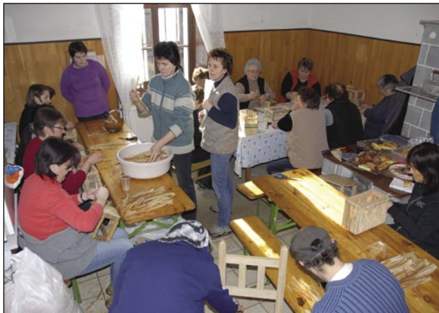
V künji staroga farofa so ženske plele iz kukarčnoga lupinja

V okviru projekta Saused k sausedi je Razvojna agencija Slovenska krajina znauva organizirala delavnico rokodelstva. Tau je zali, kak trbej cejkare pa stauce plesti iz kukarčnoga lupinja. Bile so taše ženske, stere so že na prvom srečanju na pau splele svoje