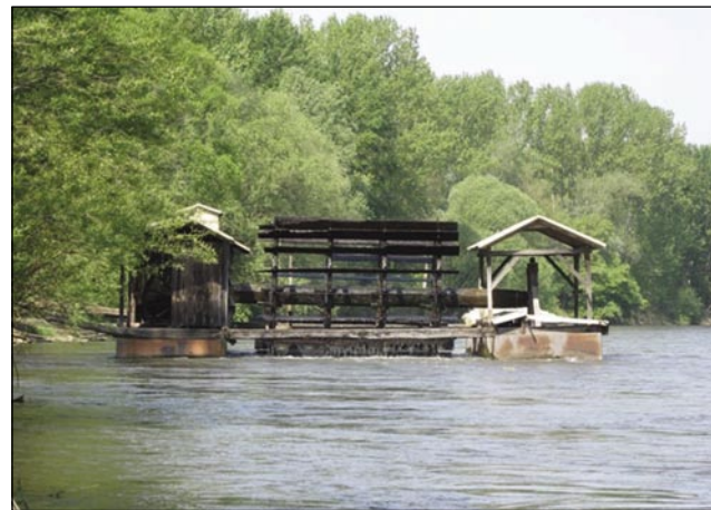
Na Müri je austro samo eden plavajoči mlin

gestejo. »Zobl pa lük« ali zaseko ne gejo samo te, če škejo kaj brž zesti, liki te tō, gda med koštavanjom vina nücajo nika bole žmetnoga v želaudci. Takzvana »tünka« pa je eške bole tipično gesti za Prlekijo. Tau so te vönajšli, gda eške zamrzovalnikov nej bilau pa so steli, aj mesau duže dobro ostane. Iz svinjskoga mesa oprvin čonte vözujemo, te pa ga dajo v sau, fajfer pa drüge začimbe. Süjo ga pacajo tri dni, te ga polegöjo s slanovodauv, v šterog ga njajo en mesec. Na konci mesau sölnkivajog (okadijo) pa spečejo, pa ga dajo