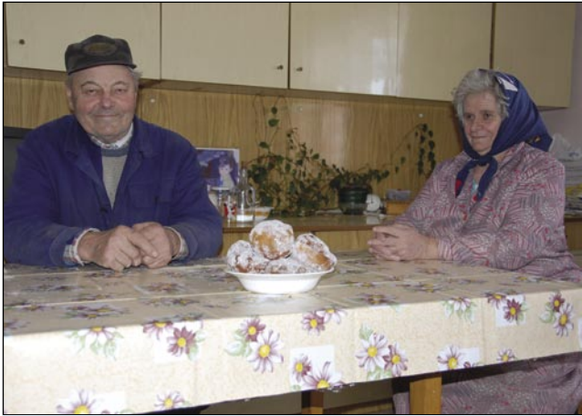
Pri Pufarni v Števanovci fašenski torek ne more biti brez fankov

se letos fantje posrečile? »Dobre so, dobro so se posrečile. Leko se tak zgodi, ka so nej najbalkše. Tau se te zgodi, če se ne dje-nejo tak, kak bi trbelo, pa bola žete ostanajo. Dapa tašo se je pri mena že davnik nej zgaudio.«