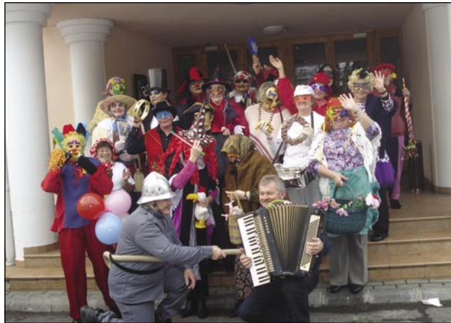
Gasilska slika maškar pred Slovenskim daumom

Porabski slovenski penzionisti smo 14. februara pozdravljali fašenek. Že par lejt si tak mislimo, ka tau šego moramo zdržati. Če mi, starejši nemo kazali, kak je inda svejta bilau, te se rejsan tapozabi ta tradicija. Hvala Baugi, ka mamu v našom društvu takše člene, steri se vzemejo za tau, stere je nej ftraga, si prinesejo kakšo maškaro pa se notoblečejo.