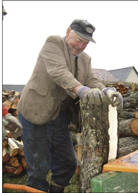
Pufarni Vendel drva za mesau kaditi že naprej pripravijo

»Pri nas so nej bili, pa mislim tau leto nišče ne odi. Istino, lani pa predlani je že tō tak bilau, ka niške je nej odo kaulak. Zdaj je že nej tak kak prvin. Te je lüstvo pa mladina bola doma bila, pa so meli čas na fašenek odti. Bilau je tak, ka so tri skupine odle po vesi. Zdaj vsakši dela, pa nej majo časa. Dopust pa ne smejo prositi zdaj, ka so radi, ka sploj majo delo. Etak se pa ta