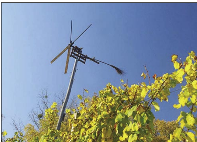
Klopotec ropoče, ftiči bežijo

»Prva, kak bi se napautili...« - bi leko začnili štrti tau svoje prauti po Sloveniji, depa če se že pelamo v Prlekijo, moremo tak povodati: »Prle, kak bi se napotili...«. Prleki so ranč s te rejči dobili svoje ime, ka so njini sausedge tau največkrat od nji čüli.