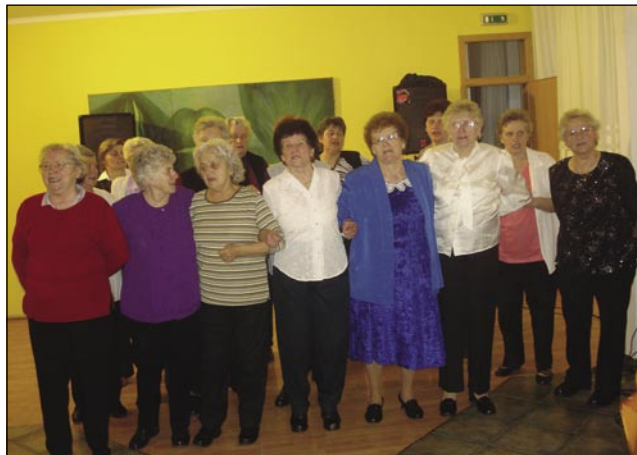
Priložnostni pevski zbor je popejvo porabske naute

Na fašensko nedelo v dvej vōri smo se zbrali v Slovenskom daumi v Varaši. Najprva smo si malo vsedli v konferenčni dvorani pa členom povedali, kak se je predsedstvo odlaučilo, ka vse smo planirali za eto leto. Potejm smo se pa šli opraviti