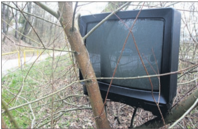
Televizor z »naravnim razgledom«

Zbrani nevarni odpadki iz gospodinjstev se začasno skladiščijo v prehodnem skladišču Regionalnega centra za ravnanje z odpadki Celje. Iz tega skladišča jih nato predajo specializirani organizaciji, registrirani za zbiranje in odstranjevanje nevarnih odpadkov. Nekatere odpadke predelajo v sekundarno gorivo za cementarne (olja in razredčila), druge zažgejo (zdravila, sredstva za zaščito rastlin), kisline nevtralizirajo in baterije predelajo.