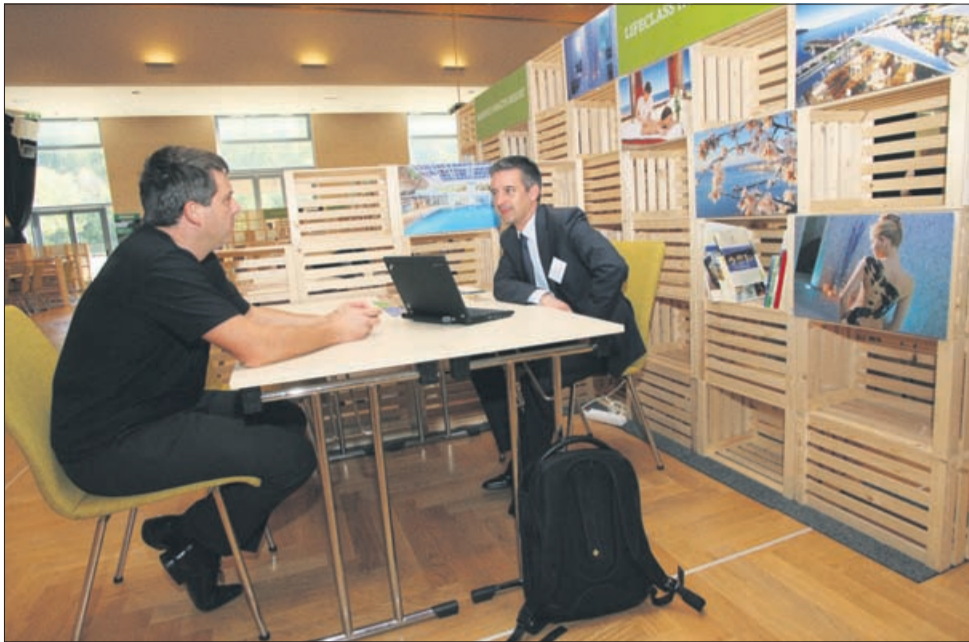
Na borzi v Laškem se je predstavilo 15 slovenskih zdravilišč, povezanih v skupnost, ter nekaj tujih iz osrednje Evrope.