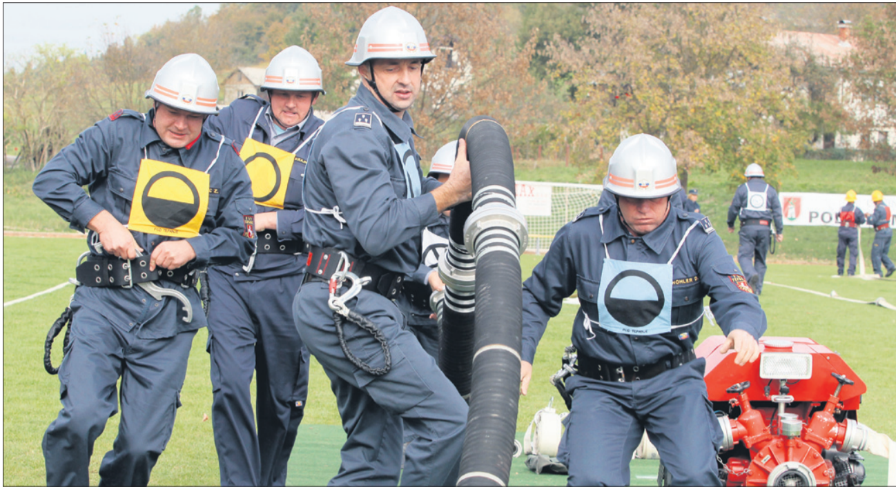
Teh tekmovalcev v mrzlem kozjanskem dopoldnevu zagotovo ni zeblo.