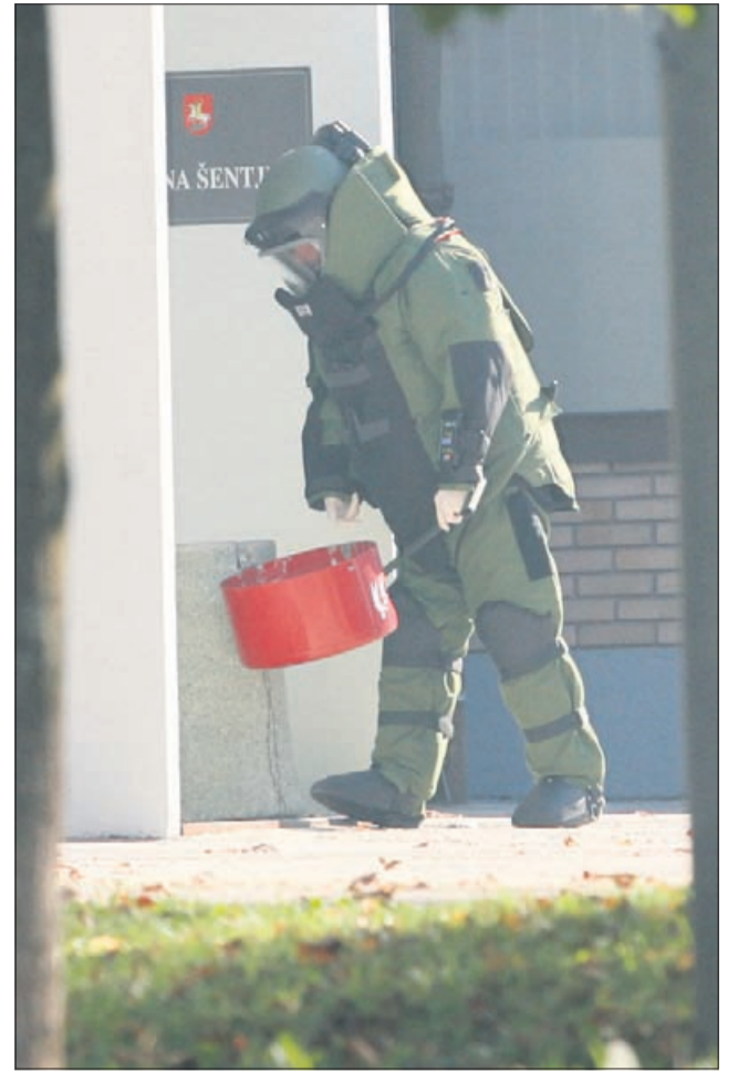
Potem ko so z daljinsko vodenim robotom spraznili sumljiv koš za smeti, si je zadevo od blizu ogledal še bombni tehnik.