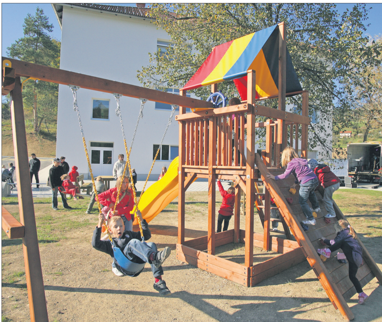
Vaško jedro Dobrine bo odslej še bolj privlačno za druženje krajanov in razposajeno igro otrok.