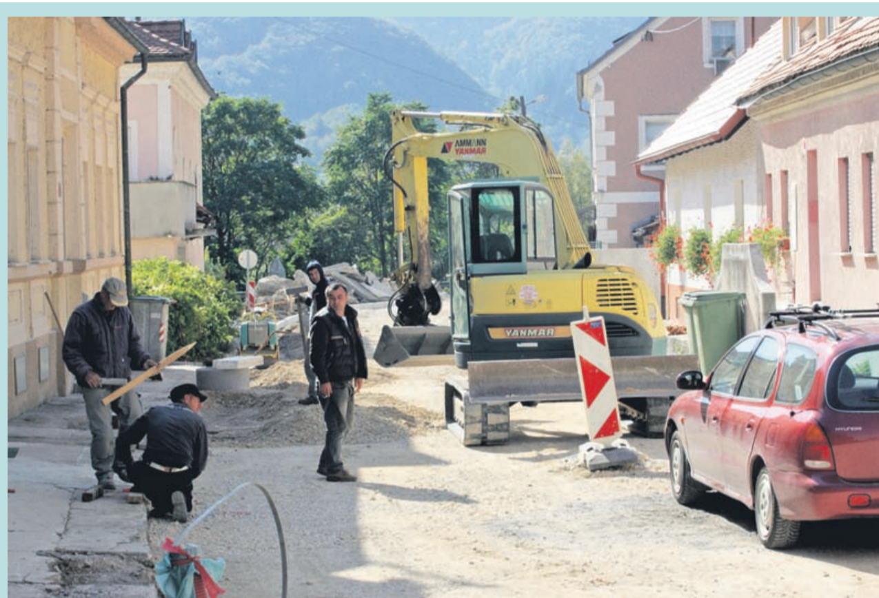
Hiše na Bregu je včasih delila stara cesta v Laško, zdaj je to mirna ulica, za katero ljudje vzorno skrbijo.

»Nihče ne oporeka načrtu – ulica bi bila fenomenalna, res bi bila lepa. A zakaj nismo imeli možnosti povedati svojega, ko je bilo še čas za to. Tako se to ne dela. Živela bom kot na Beverly Hillsu, a