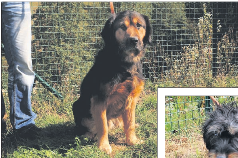
Tudi Lex je star 5 let. Našli so ga v Laškem.

Trije prijazni kosmatinci iščejo skrbnega gospodarja in nanj čakajo v zavetišču Zonzani.