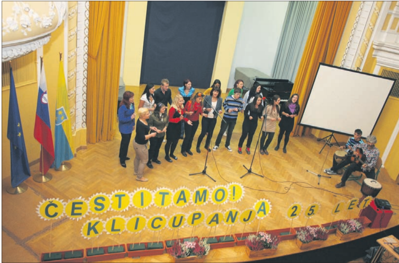
25-letnico društva Klic upanja so popestrili z bogatim kulturnim programom.

Ideje, morda celo predsodki, kdo vse kliče na telefon za pomoč v stiski, hitro padejo, ko izvemo, da kličejo vsi. Mladi, stari, moški, ženske. V povprečju največkrat telefon zavrtijo ljudje med 25. in 50. letom. Težave so povsem življenjske. So pa tudi večji problemi, nadaljuje Pahljina: »Veliko ljudi pokliče, ker imajo neke psihične motnje in poleg uradne medicine potrebujejo še nekoga, ki jim bo stal ob strani, bo njihov sopotnik. V takih primerih opravljamo delo podaljšane roke psihiatrije in mislim, da je to tudi dokazljivo. Recimo