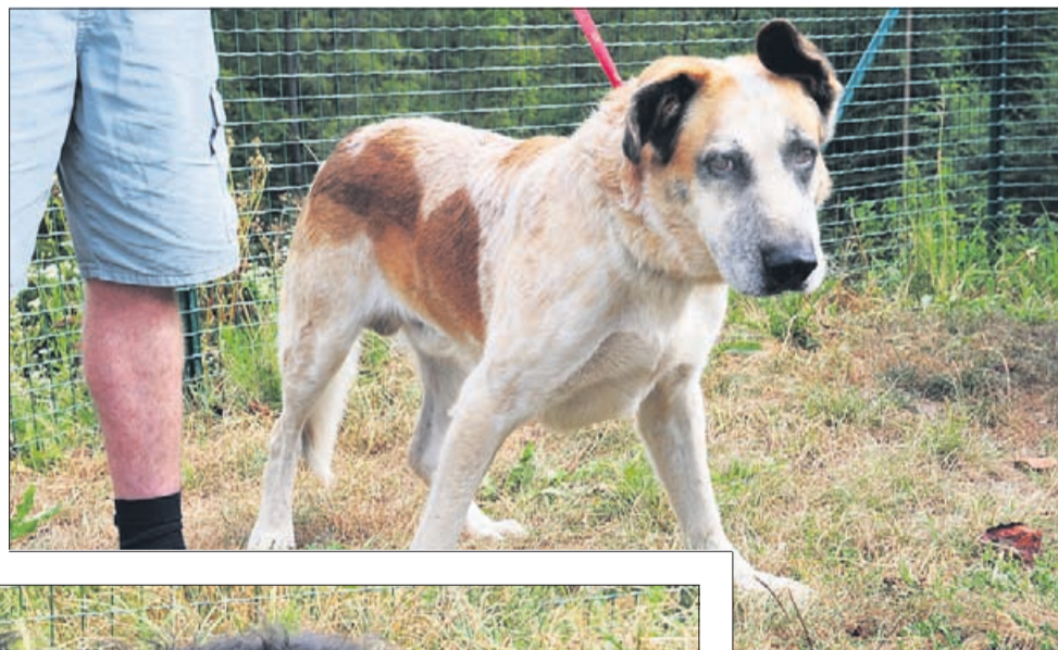
5-letni Bob je mešanec večje rasti.