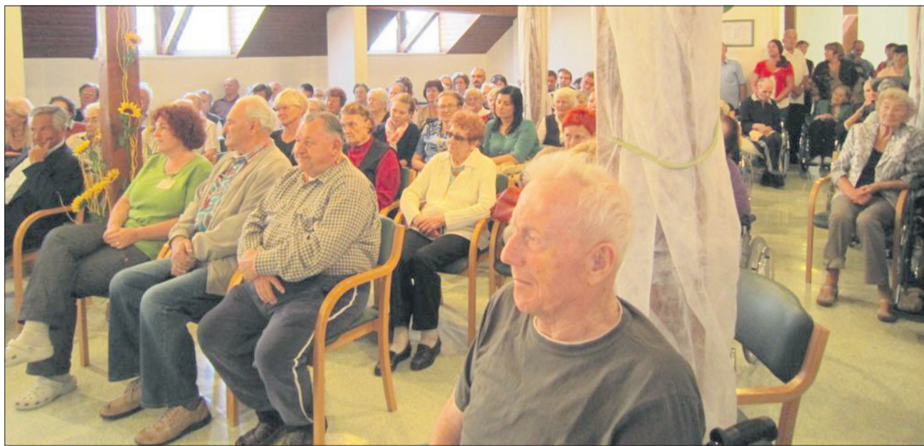
Obiskovalci v domu so si lahko ogledali razstavo ročnih del, v fizioterapiji so se lahko poskusili v športnih igrah, po uvodnem programu pa je bila priložnost celo za ples.