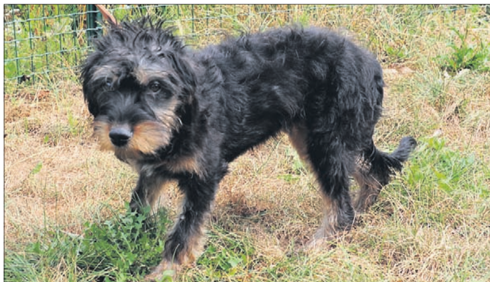
Tara je mešanica manjše rasti, stara 8 mesecev, sterilizirana.