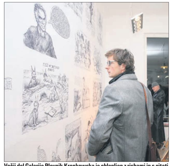
Večji del Galerije Plevnik-Kronkowska je oblepljen z risbami in s citati iz umetnostne zgodovine, filozofije in pop kulture.