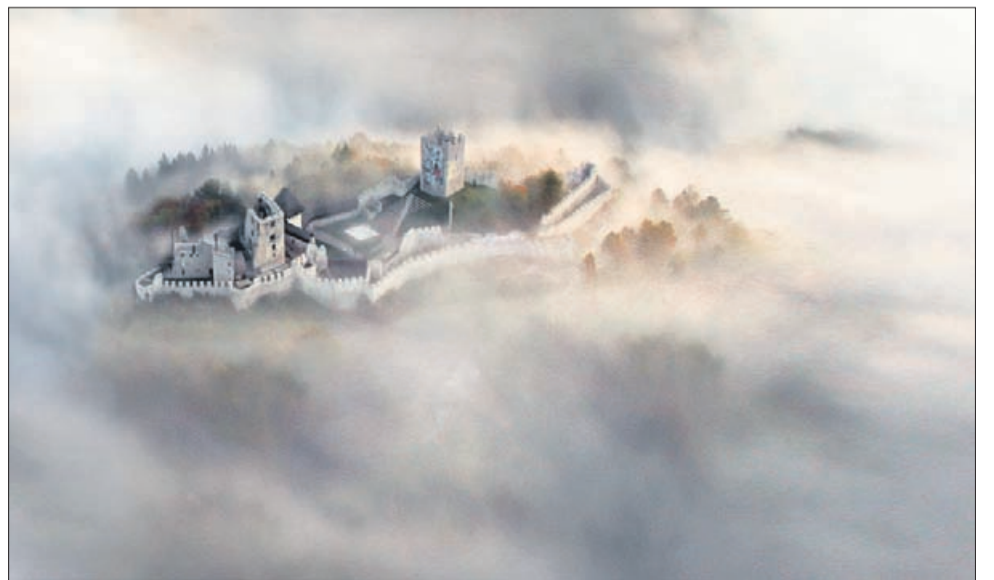
Fotografijo z naslovom Začaran je posnel kandidat za mojstra fotografije Matjaž Čater, objavljena pa je bila v številnih revijah po svetu.