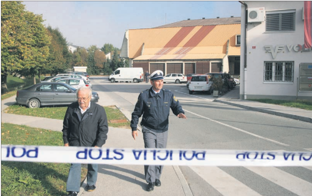
Čprav so vsi slutili, da gre za neslano šalo, je bilo nekaj ur stanje v Šentjurju zelo resno.