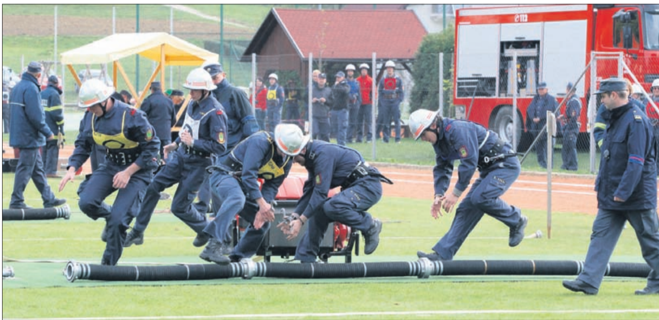
S tako urnimi gasilci bo vaš požar hitro pogašen.