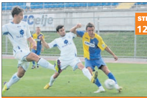
Grofje prvič zmagali v Lendavi