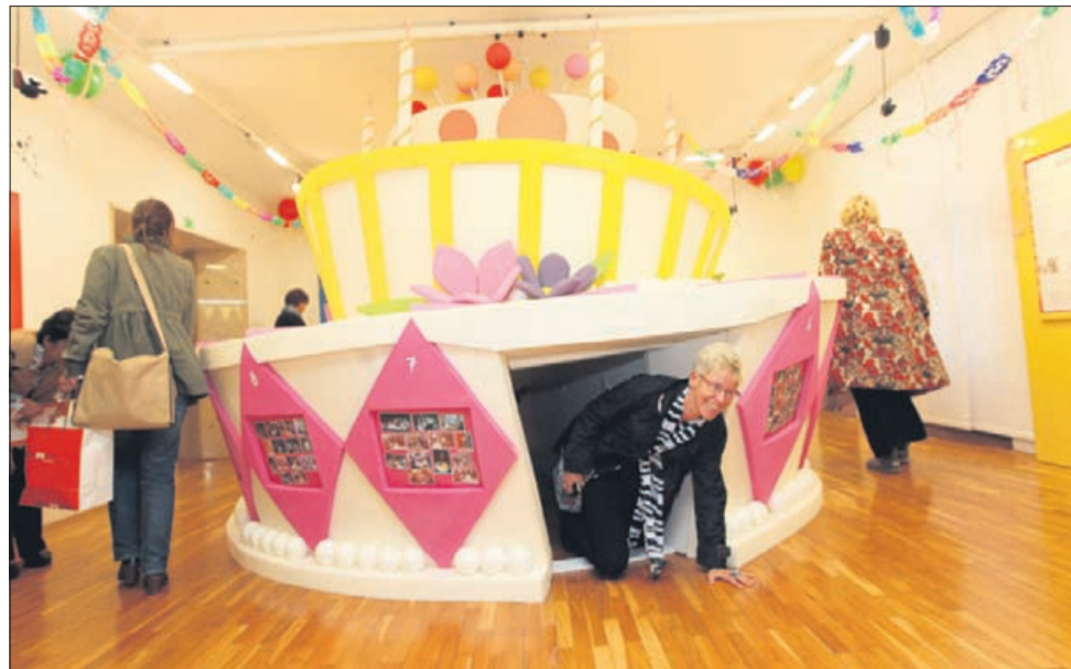
Osrednje prizorišče razstave je gromozanska rojstnodnevna torta, v katero lahko tudi zlezete.

Tema tokratne razstave, ki so jo odprli, tako kot se spodobi – z velikansko torto in množico balonov – je predstavitev rojstnega dne