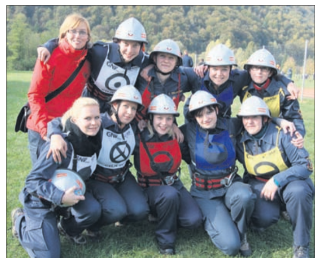
H gasilstvu spada prijateljstvo. Na fotografiji ekipa iz Nove Cerkve pri Vojniku.