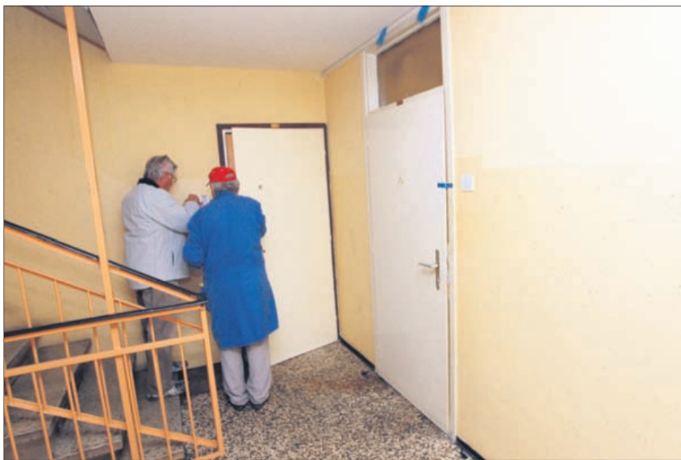
Izza teh vrat je gorelo.