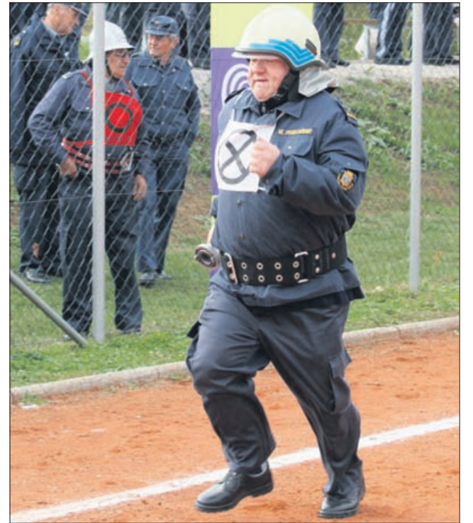
O predanosti Slovencev prostovoljnemu gasilstvu ni treba izgubljeni besed.