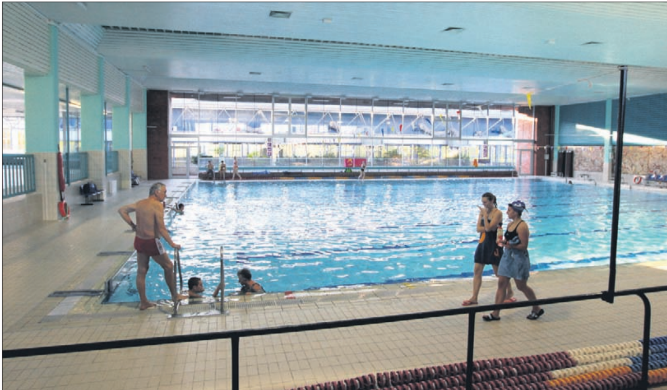
Zimsko kopališče v Celju so z brezplačnim kopanjem med 15. in 20. uro odprli v nedeljo, rekreativno plavanje v njem pa bo mogoče do junija.