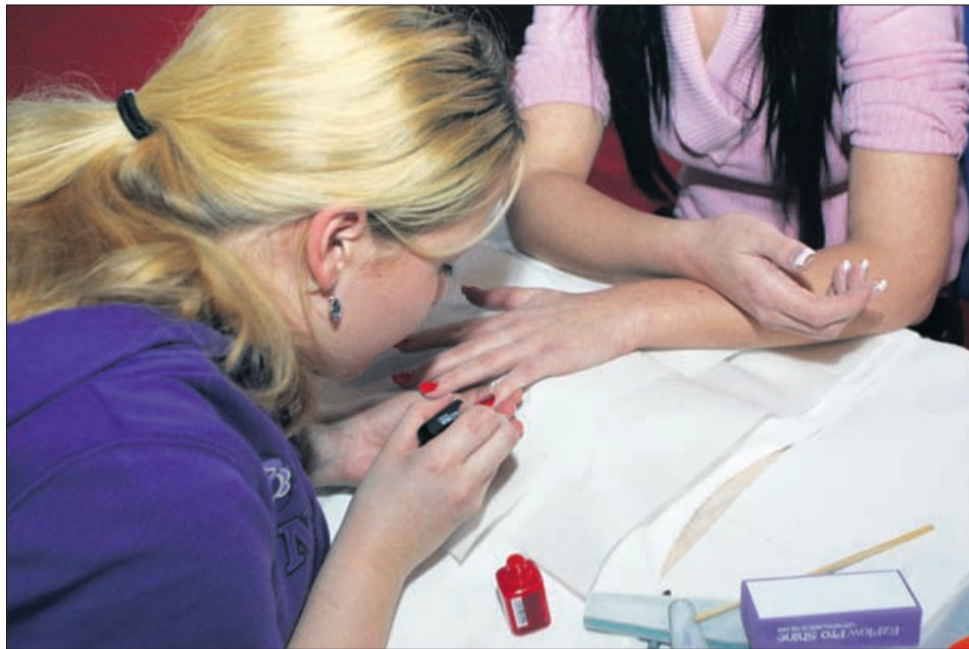
Za lepe nohte ni treba vedno k strokovnjakom.