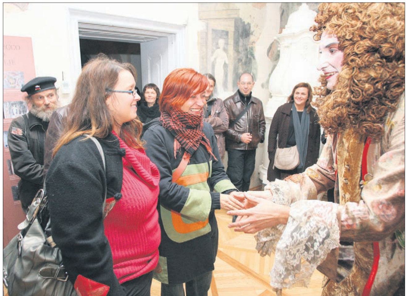
Vodenje po stalni razstavi v pokrajinskem muzeju – po Jaševo. Zabavno, provokativno, a tudi poučno.