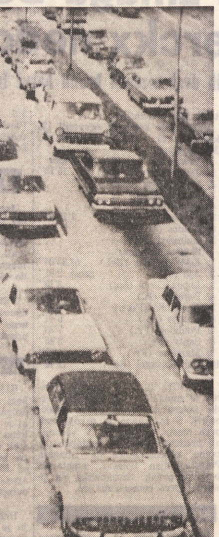
Svetovno nogometno prvenstvo je končano. Po razburjenem turnirju, v katerem so njihovi ljubljenci osvojili prvo mesto, si nemški turisti lahko končno privoščijo odhiti na Jadranu. Na mejnem prehodu pri Senčljahu se v teh dneh vije dolga kača nemških in avstrijskih avtomobilov, nabito polnih turistov, ki se odpravljajo na počitnice

Knjižna obravnava ljudska štetja, krajevne napise socialne razmere, in gospodarske koroški Slovenci v katerih živijo koroški Slovenci S tem opozarja na težke razmere S in na krivice, ki se jim godijo. Koroški Slovenci bodo razposlali knjižno političnih institucijam in šolam, razdelili jo bodo na mednarodnih kongresih, dal jo bodo članom kontaktnega komiteja na Dunaju. Pisci menijo, da bo imela knjiga v avstrijski javnosti velik odmev in bo prikazala kako neobjektivna so stališča do manjšinskih vprašanih, ki so jih v zadnjem času predstavljali avstrijski pred-