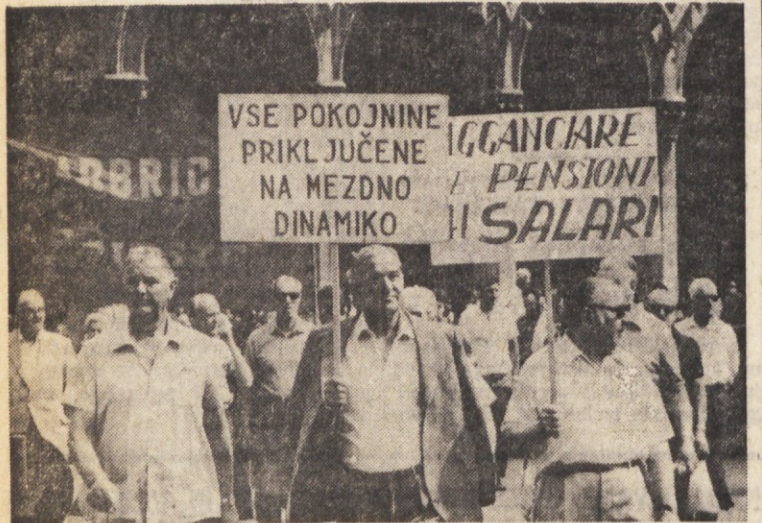
Na upokojece vlada najraje... pozablja