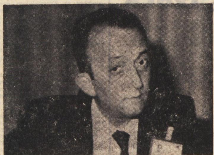
TULLIO DE MAURO

Obsežne mase delavcev in kmetov se dvigajo iz zaostalosti in polagoma dosegaajo kulturno bogastvo, ki je bilo nekot rezervirano za tako imenovane elite. Toda pri tem se čedalje širši sloji človeštva izpostavljajo nevarnosti, da izgubijo stavižajo nevarnosti, da izgubijo svojo etnično istovetnost in — če se proces nadaljuje do skrajne meje — tudi možnost nastopanja opozicijske sile zoper hegemonijo buržojskega razreda in kapitalističnih držav.