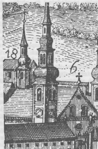
Detalji iz Valvasorjeve vedute Ljubljane (1685): a) ura na zvoniku cerkve sv. Petra, b) ura na zvoniku ljubljanske stolnice, c) ura na stolpu piskačev, d) ura na zvoniku cerkve sv. Jakoba