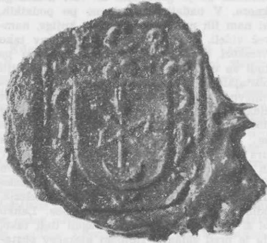
Pečat urarskega mojstra Hannsa Conrada Seiberja na listini iz leta 1609. (ZALJ, Ljubljana)

odprla vrsta novih vprašanj in seveda tudi odgovorov, ki bi lahko bili solidna podlaga za nadaljnje razpravljanje o nastanku »prve in druge« mestne ure in ne nazadnje o izgradnji lesenega (1440?) in pozneje zidanega (1553?) stolpa piskačev.