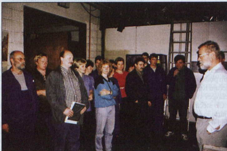
Okoli 130 delavcev Tovarne Muta Kmetijska mehanizacija je stavkalo pet dni.

Na zadnjih pogajanjih sredi minulega tedna je Smrečnik poudaril, da bi delavci radi začeli delati, saj poslovni partnerji že nestrpnost ča-