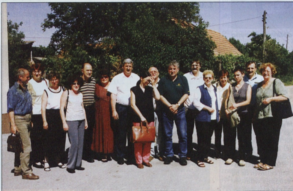
Udeleženci študijskih krožkov in gostje so najprej obiskali vasi na sosednjem Hrvaškem, od koder prihajajo dnevni migranti na delo v Slovenijo.

Ob takšnih meddržavnih sporazumih so dnevni migranti, ki izgubijo delo v Sloveniji