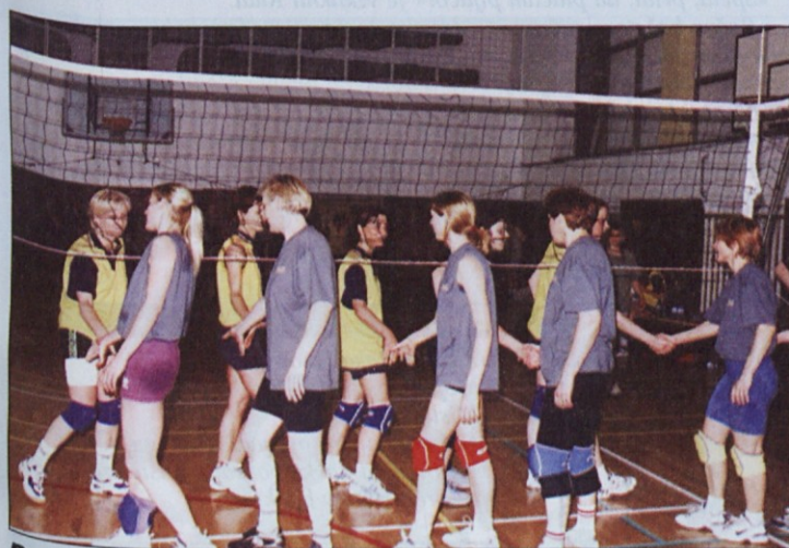
Po finalni tekmi v odbojki (zmagale so sinlesovke iz Marlesa v sivih majicah) so se tekmičice prijazno pozdravile. Gledalci smo uživali v dobri odbojki in tudi drugače je bilo kaj videti.