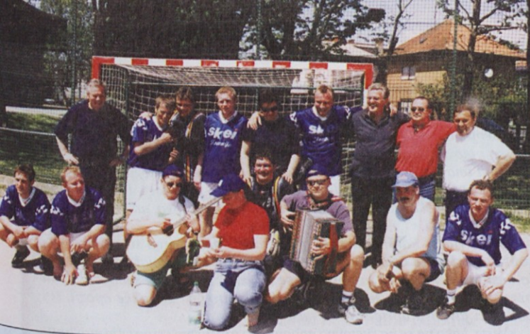
Nogometašem SKEI (nastopala je ekipa iz Štor) je uspelo zmagati. Več težav kot v finalu z ekipo SDPZ so imeli v predtekmovalju, ko so nasprotnike premagali šele po enajstmetrovkah.