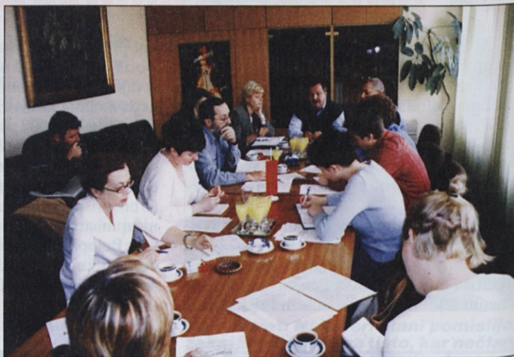
Novinarske konference, ki jih organizira območna organizacija ZSSS v Celju, so vedno dobro obiskane.

O razmerah in ekonomskem položaju delavcev v posameznih podjetjih na območju Ce-