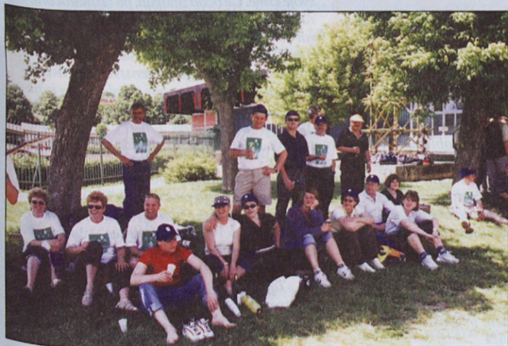
Navijačice so se med finalno tekmo (največ je trgovk) kar lepo zabavale.