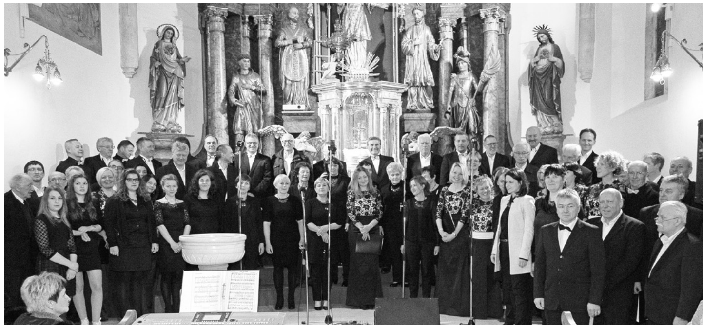
Vsi nastopajoči, združeni v pesmi