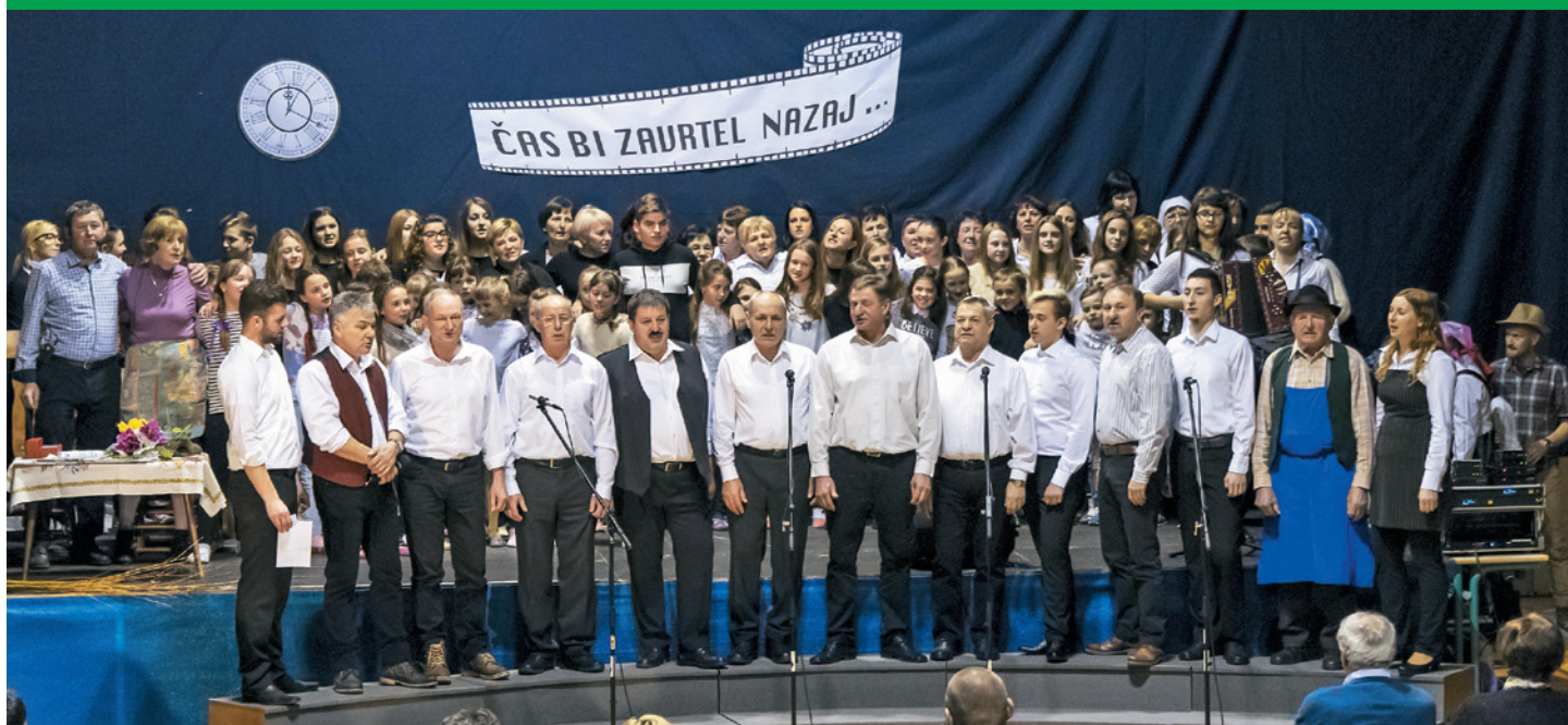
Glasbeno-gledališka predstava ČAS BI ZAVRTEL NAZAJ...