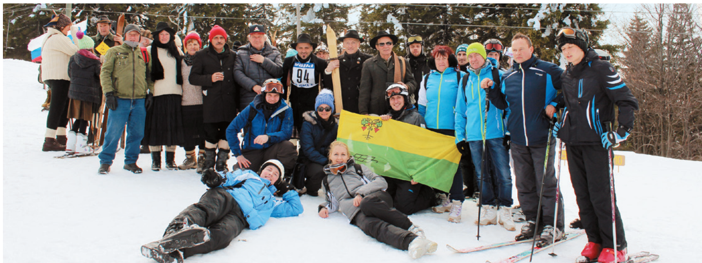
Juršinski smučarski dan na Kopah