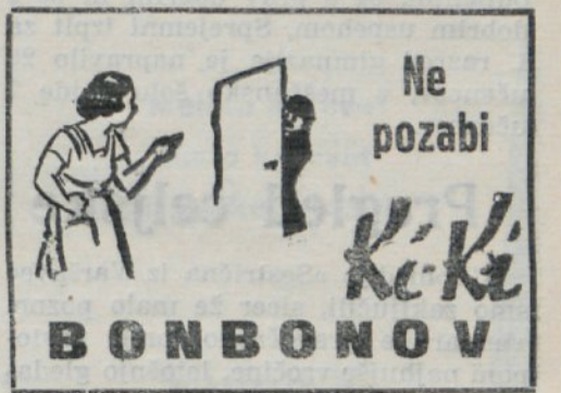
PROIZVOD: »UNION«, ZAGREB