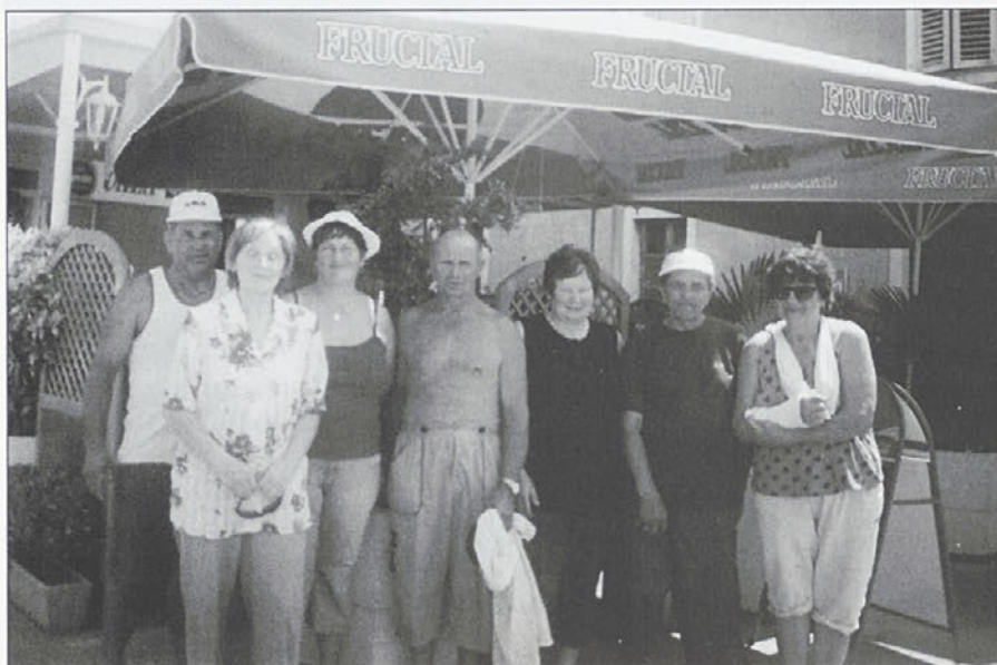
Pa še utrinek iz Izole.

Spet je pred nami nova številka glasila Majšperčan in seveda bi rada z nekaj stavki prikazala aktivnosti Društva invalidov Majšperk.