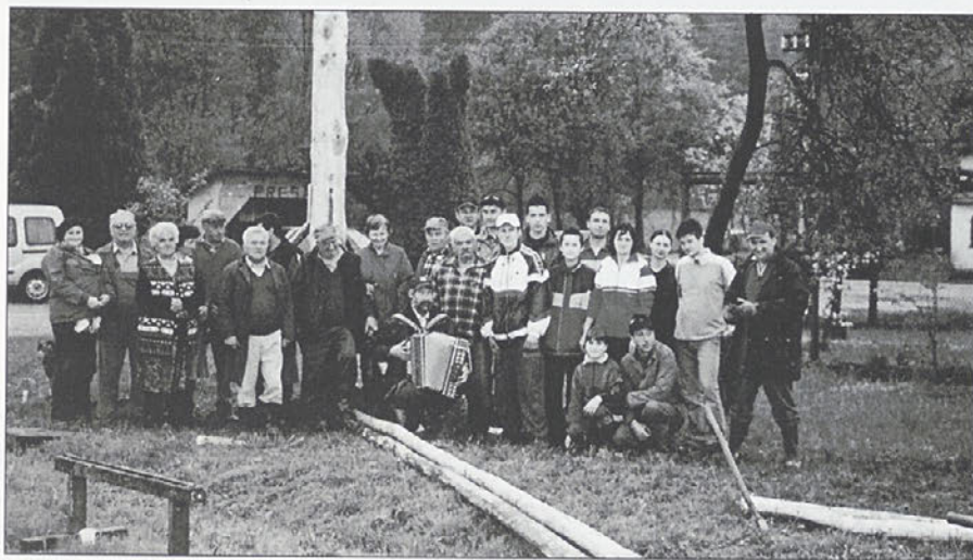
Na naši prireditvi.

Kljub deževnemu dnevju smo Prešani 28. aprila letos sklenili, da postavimo majsko drevo in tako obeležimo praznik dela, istočasno pa se spomnimo praznika upora, ki ga praznujemo 27. aprila. Veseli me, da se nam vsako leto pridruži vse več vaščanov, predvsem mlajših, na kar smo ostali, že malce v letih, toliko bolj ponosni, da imamo za nadaljnja leta obetajoč podmladek. Zahvaljujoč prav mlajšim smo majsko drevo prav zlahka pripravili za postavitve, za lepši izgled drevesa in okraske pa so seveda poskrbele gospodinje. Zaradi zadostnega števila udeležencev pri sami postavitvi drevesa nismo imeli težav, zato klic za pomoč pri dviganju (pokanje z možnarjem) ni bil potreben. Za pravo razpoloženje sem ob koncu, kot že mnogokrat prej, tudi zaigral na harmoniko, slišala pa se je tudi sprošč-