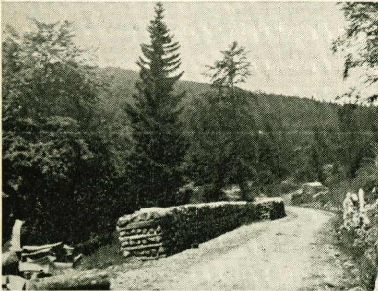
Drva z Menine

daleč od Mesorojce pod gozdovi, iz katerih spuščajo les do ceste. No, zdaj teh skladovnic ni več na planini. Jesenski čas je dvignil zanimanje za drva, dvignila pa se je tudi cena. K temu je treba pristeti še prevoz v dolžini 35 km,