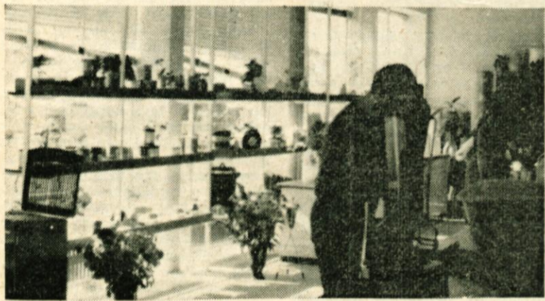
Nov lokal trgovskega podjetja »Kočna« — v poslovno stanovanjskem bloku na Ljubljanski cesti »Merkur« — specialna trgovina z železnino

Dodati moram še to, da intenzivno iščemo rešitve glede lokacij za trgovske lokale v Mostah in v Šmarci.«