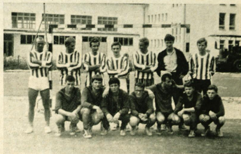
Srečanje z ekipo »Krvavca« iz Cerklj

Edina slaba stran tekmovanja je bil prekratek rok za organizacijo takega srečanja, zaradi česar so bili nekdanji najboljši atleti