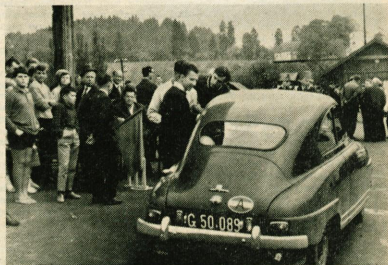
Mednarodni avto-rely

● PEVSKO DRUŠTVO »LIRA« — je po kratkem poletnem odmoru spet začelo z rednimi vajami. V novembru bodo pevci na koncertu v Kamniku izvajali program, s katerim so nastopili v Holandiji. Gostovali bodo tudi na podeželju, najprej v Šmarci v novi dvorani kulturnega doma.