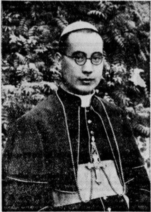
Msgr. Yu-pin, apostolski delegat v Nankingu.

Izjava posebnega odposlanca kitajske narodne vlade za katoliško Evropo, apostolskega vikarja iz Nankinga, škofa msgr. Yu-pina »Slovenecu«.