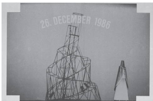
Gledališče sester Scipion Nasice: Krst pod Triglavom . Režija Dragan Živadinov, scenografija IRWIN. Ljubljana, 1986.

Iz centrov na Zahodu prihajajo določeni modeli na obrobje, umetnost na obrobju naj bi sprejela modele, uveljavljene v centrih. Centri določajo kanone, hierarhijo vrednot in stilistične norme, obrobja pa jih sprejemajo v procesu recepcije. Tudi kadar imajo obrobja svoje izjemne umetnike, je njihovo priznanje ali umetnostna posvečenost odvisna od centra: od razstav, organiziranih na Zahodu, in od knjig, ki so izšle v zahodnih državah. Leta 1992 so NSK in njihovi kolegi napisali Moskovsko deklaracijo , v kateri so poudarili, da imajo vzhodne države specifično zgodovino, izkušnjo, čas in prostor, ki jih ne smemo pozabiti, skriti, zavreči ali zatreti. V novi, postsocialistični situaciji ni več nekdanjega vzhoda in novo »vzhodno« strukturo lahko oblikujemo le tako, da se preteklost integrira v spremenjeno sedanost in prihodnost.