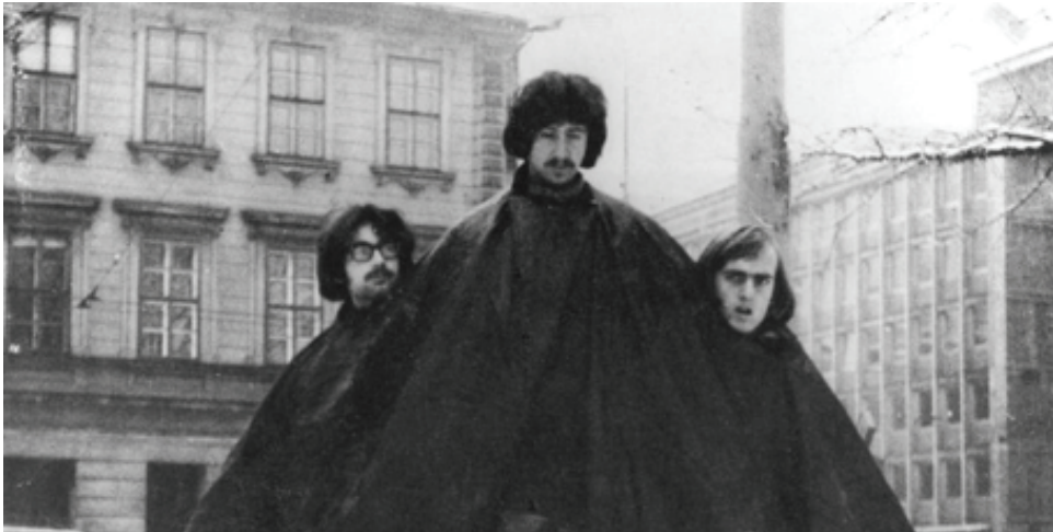
Prizor iz filma skupine OHO Triglav , 1968. Kamera: Naško Križnar. Zbirka Moderne galerije, Ljubljana.

Bolj ko se je bližal konec dvajsetih let, bolj so politične napetosti v Evropi motile razvoj avantgard. Ko je januarja 1929 Jugoslavija postala diktatura, je bil Trst že globoko vpleten v italijanske fašistične ideologije. Zdelo se je, da so avantgardne sanje začele izginjati, nova svetovna vojna se je že začela bližati. Zgodba o zenitistični in slovenski konstruktivistični politični in estetski revoluciji, ki bo spodmaknila tla zahodnoevropski buržoazni družbi, je bila s tem končana.