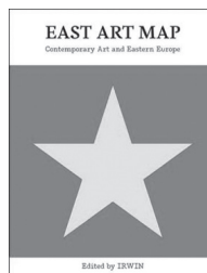
Naslovnica knjige East Art Map: Contemporary Art and Eastern Europe , ki jo je uredila skupina Irwin. MIT Press, 2006.