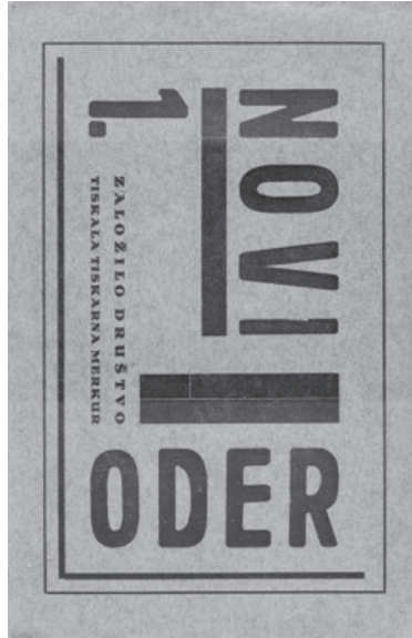
Naslovnica revije Novi oder .

je oblikoval zelo osebno združitev futurizma in konstruktivizma ter jo najprej propagiral v Ljubljani (1924–25) in nato v Trstu (1925–29), kjer je ustanovil konstruktivistično skupino Gruppo costruttivista ter umetniško šolo, ki je temeljila na načelih Bauhauasa.