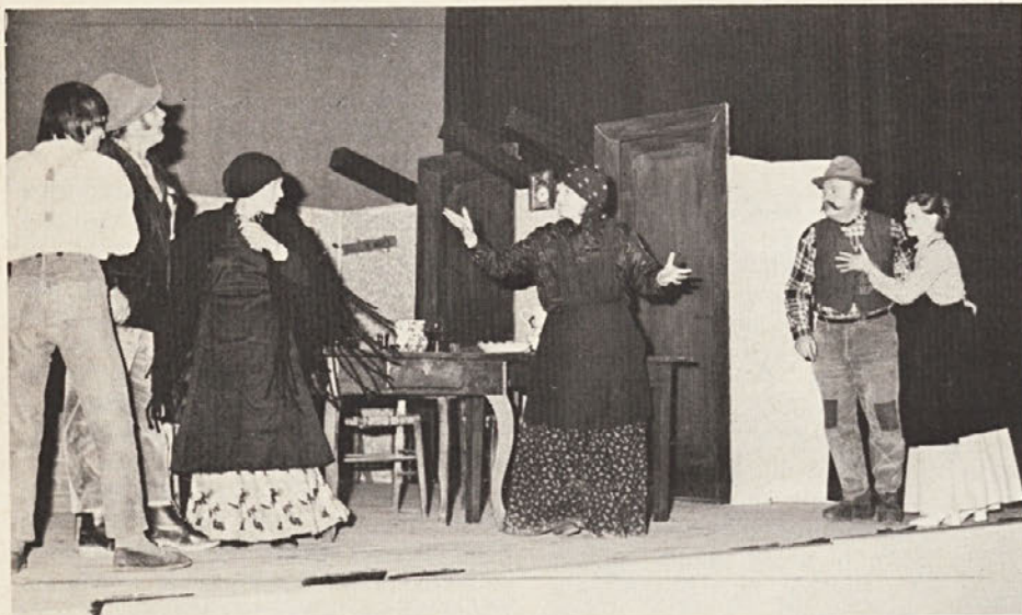
Prizor iz Predanove ljudske igre "Beneška ojcet"