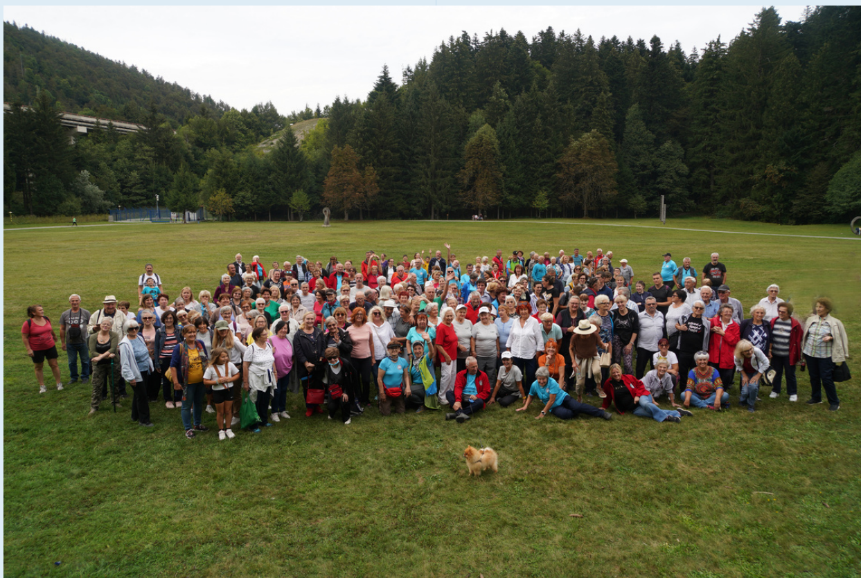
18. Vseslovensko srečanje, Golubinjak, 3. 9. 2022

23. septembra 2000 je na olimpijskih igrah v Sydneyu prvič zaigrala slovenska himna. Zdravljica je zaigrala v čast našim olimpijcem, veslačema Iztoku Čopu in Luki Špiku ter strelcu Rajmondu Debevcu. (Vir: https://danslovenskegasporta.si/ )