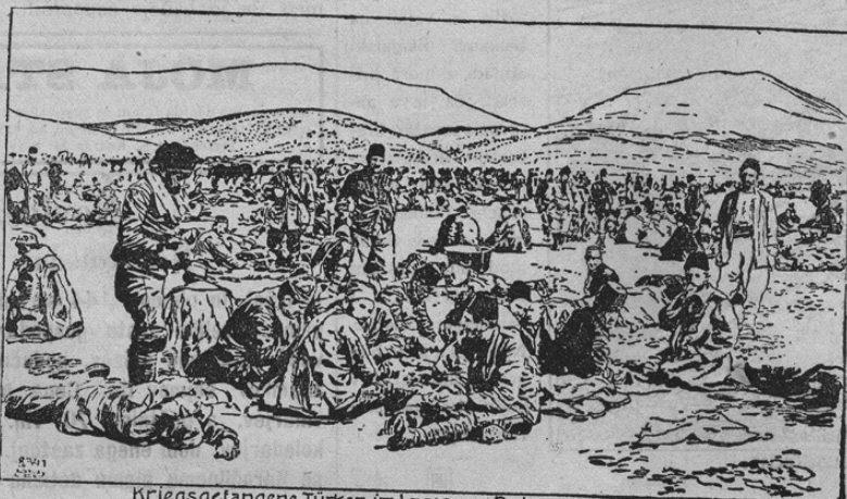
Kriegsgefangene Türken im Lager von Podgoritz

Mesto Podgorica bilo je že začetkom te grozovite balkanske vojne ena najvažnejših postojank in glavno taborišče črnogorske armade. Naša slika kaže v krvavih bojih okoli trdnjave Skutari vjete turške vojake, ki so jih spravili Črnogorci v svoje taborišče v Podgorici.