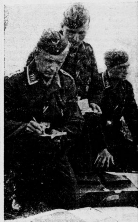
Skupina nemških letalcev beleži napotke pred startom k poletu nad Anglijo