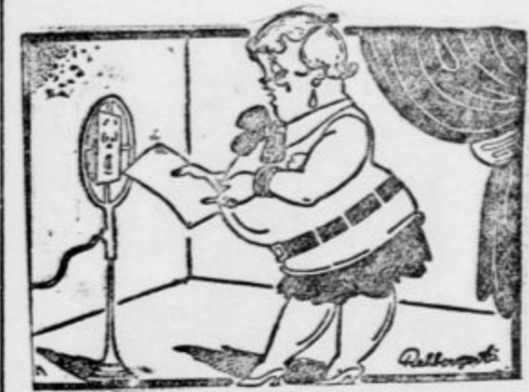
Predavanje v radiu

»In zdaj, cenjene poslušalke, se začne predavanje o vitki liniji...«