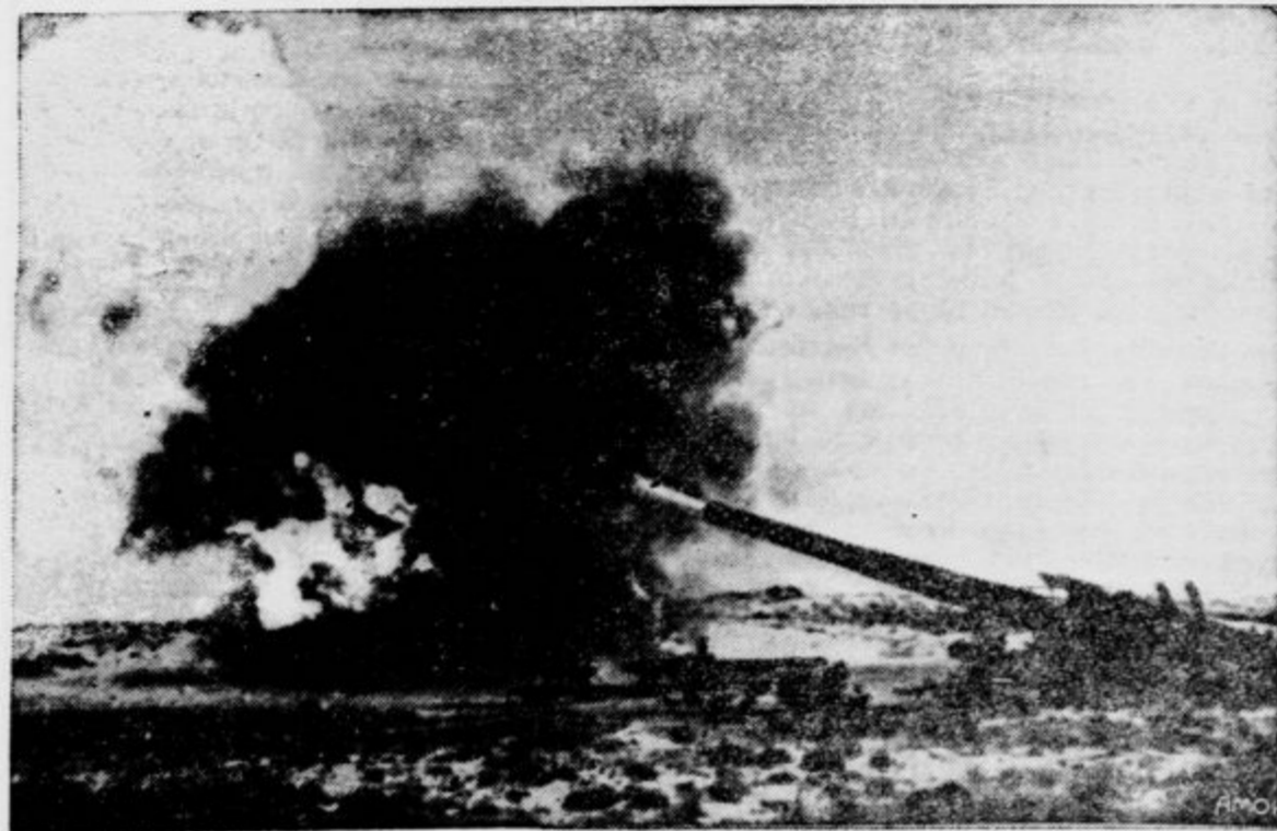
In sicer zaenkrat samo še za vajo. Vsak takšen izstreljek iz topovskega žrela trdnjavo Tilden pri New Yorku stane 3000 dolarjev