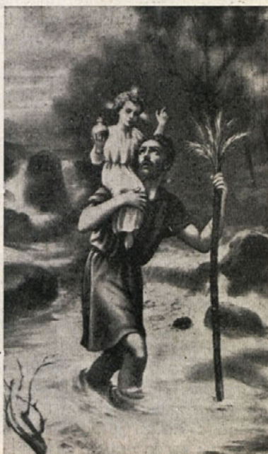
Sveti Krištof, prosil za nas!

Očetje puščavskih samostanov so bili vsi enakega mnjenja, da Jona nima poklica za njihov način življenja. Obrnil se je bil na vsak samostan po vrsti in povsod je dobil isti odgovor. Jona je bil orjaška grča, ki je z mišicami doprinesel, kar mu je manjkalo v možganih. Če še povemo, da je bil močno nagnjen k neki napaki, je s tem stanje stvari na las natanko opisano. Jona je imel jezik, ki mu je migal kakor rep prijaznega psa, kadar opazi, da se bliža tovariško bitje — saj je bil res podoben velikanskemu, prijaznemu psu. In kadar se je Jonov jezik sprožil, so besede drle s hitrostjo svetlobe, ki je — kot vam povedo zvezdoslovci — zelo velika. Potem ko je šestič ali sedmič prelomil molčanje in z vso zgovornostjo odkrito priznal, da spada to k poglavju napak, so Jona zgrabili za njegova široka pleča in ga vrgli iz samostana.