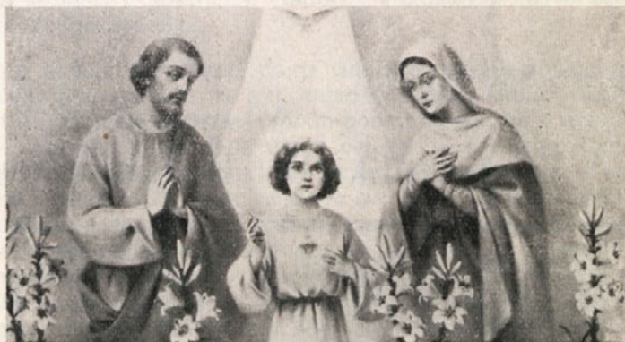
Sv. družina: Jezus, Marija, Jožef

V življenju sv. Ivane Šantaljske, učenke ljubeznivega sv. Frančiška Sal. beremo, da je na notranji samostanski zid dala napisati tiste lastnosti božje ljubezni, ki jih je sv. Pavel po božjem navdihnjenju v svojem prvem pismu Korinčanom tako mojstersko zarisal. Tako-le jo opisuje: »Ljubezen je potrpljiva, je dobrotljiva; ljubezen ni nevoščljiva, se ne ponaša, se ne napihuje; ni prešerna, ne išče svojega, se ne da razdražiti, ne misli hudega; se ne veseli krivice, veseli se pa resnice, vse opraviči, vse veruje, vse upa, vse prenaša. Ljubezen nikoli ne mine« (13, 4—8). Kadar se je kaka njena duhovna hčerka kaj proti sestriški ljubezni pregrešila, se je morala iti v to duhovno ogledalo pogledat. Ko je ugotovila, proti kateri lastnosti ljubezni se je pregrešila, ni smela prej proč, dokler ni s kesanjem izbrisala madeža. Zato je v samostanu vladala lepa sestriška sloga in ljubezen, oziroma je bila takoj zopet vpostavljena, če je bila kaj skaljena.