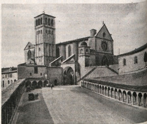
Bazilika sv. Frančiška v Asiziju

Pred svojo smrtjo je serafinski oče v svoji ponižnosti prosil, naj ga pokopljejo na tako imenovanem Peklenskem griču zunaj Asizija, kjer so ponavadi pokopavali hudodelce. Tako se je tudi zgodilo, vendar drugače, kot si je mislil ponižni služabnik božji. Svetnika so najprej pokopali v cerkvi svetega Gregor IX. 16. julija leta 1228. prišel med svetnike, so začeli zidati nad njegovim grobom krasno cerkev. Postavili so jo na Peklenskem griču, ki se od sedaj imenuje Nebeški