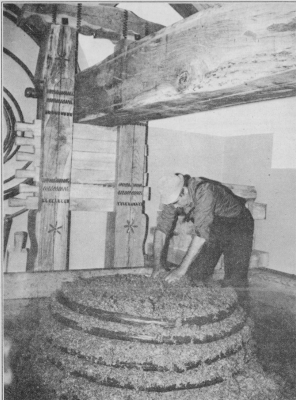
DO ZADNJE KAPLJICE • Če letošnjega pridelka zlahne kapljice ne bi prizadela suša, bi bil zagotovljen eden izrednih tako po količini kot po kakovosti; vsaj tako trdijo kletarji. Pa je za nemeček tik pred trgatvijo sredi prejšnjega tedna ponekod udarila še toča; predvsem v okolici Lačaves in Vodranskega Vrha. Zato se je treba še posebej potruditi za vsako jagodo posebej. Tudi na preši! • Foto: M. Ozmeč