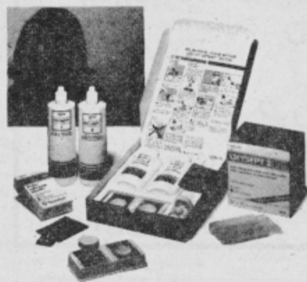
kontaktne leče in tekočine