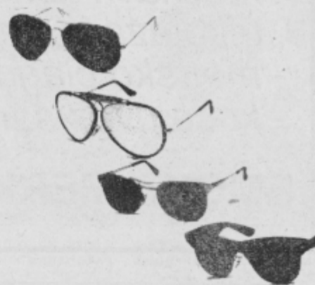
bogata izbira sončnih očal