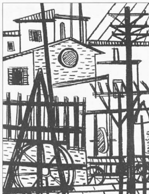
Lojze Spacal: Ladjedelnica III, 1952 (črna voščena kreda)

LEV: Malce več časa posvečajte partnerju in domačim, ne izmikajte se zaradi delovnih dolžnosti. Delovno okolje