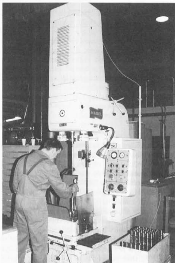
Stroj za honanje