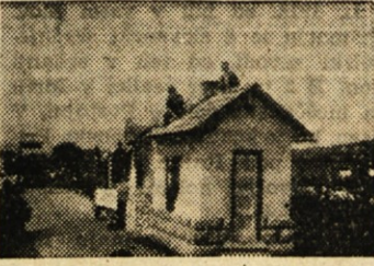
Alegorični voz: obnovitvena dela