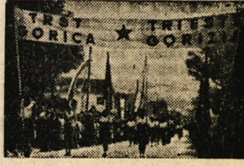
Tržišče in Gorizia v povorki

Ob zaključku Titovega tromejnega tekmovanja, sijajne nove manifestacije prebivalstva cone B za priključitev k Jugoslaviji, se je predvčeršnjem vršila v Ajdovščini «Parada dela». Sama beseda pove dovolj: bila je parada, bil je mimohod delovnega ljudstva, ki je polagalo samo sebi svoj obračun — upravičeno ponosno na dosežene uspehe. Teško bi bilo — če je sploh mogoče — poplati vse napore, ki so rodili tisoče in tisoče krvavih solz, razboljenih mišic, da ti lahki utrjenosti ni dalo spati, te težje silno voljo, ki je bila pre-ko tehlik razmer in gradila, ustvarjala — žudeže. Ustavimo se zato pri številnih delovnih rezultatih in doživljajih: