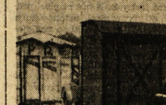
Alegorični voz «Prebrade»: očitni polciot in član Partito d'Azione jemljeta iz vagona UNRRA pakete