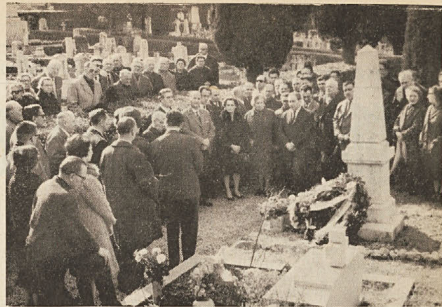
Počastitev spomina sovjetskih partizanov, ki so pokopani na vojaškem pokopališču v Trstu. Sestavek objavljamo na 4. strani

Programatična izjava ne vsebuje nič novega glede zunanje politike, ki naj oddalji Italijo od soodgovornosti za ameriško agresijo na Vietnam, ki naj odpravi tuja vojaška oporišča v deželi, ki naj prispeva k razvoju odnosov z vsemi država-