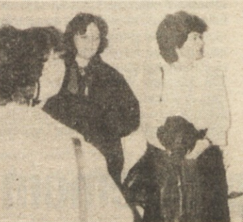
MAJHNI IN VELIKI — 24. novembra so odprli nove prostore otroškega vrtca v stari trebanjski osnovni šoli...