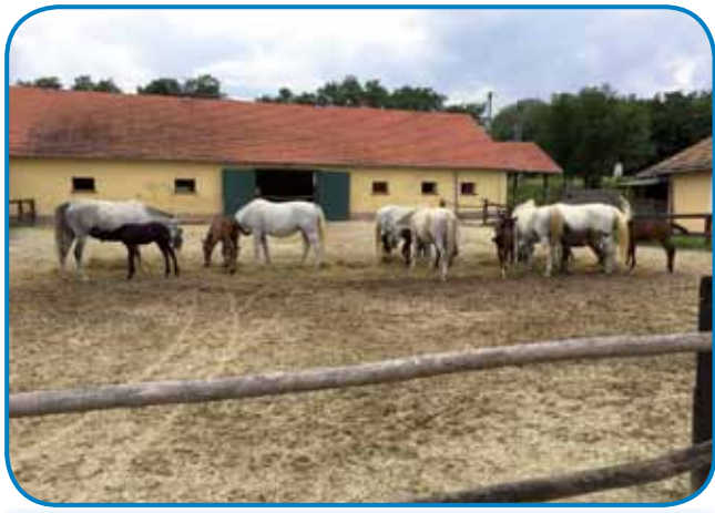
Lipicanci samo v vözraščeni lejtaj zadobijo bejlo farbo - v Szilvásváradu tö

sem pomalek že kauli Egera odo. Te mi je v bregaj Bükk v okau spadnilo edno poznano ime: Szilvásvárad . Nika sem že čüu od té vesnice, te pa mi je blisnilo, ka tam konje majo. Pa nej vsakdanešnje konje, liki vrnau takše z Lipice, s slovenskoga Krasa. Telefon mi je pokazo, ka leko v dvej vöraj tapridemo, vej so pa tri frtale poti avtoceste. S starišami smo se zgučali, ka démo, če rejsan je čeden tivariš za drügi den dežine oblake kazo.