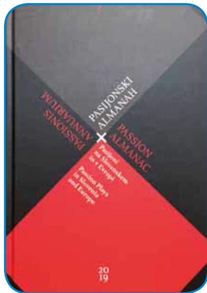
Pasijonski almanah 2019/3