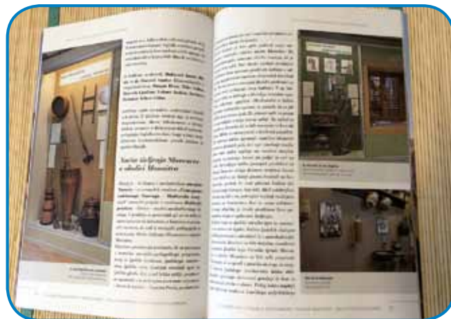
Predstavitev slovenske etnološke razstave z besedilom in slikami