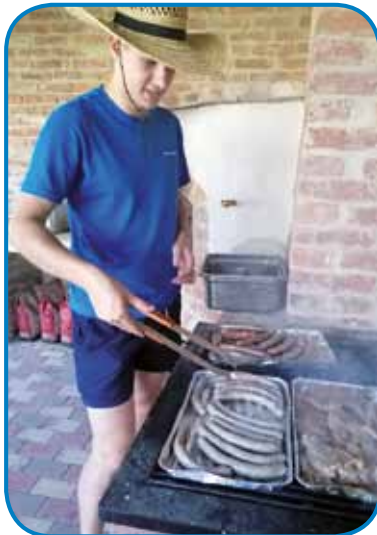
V Andovcih so nam zakurili peč, da smo spekli klobase

let, najmlajša, ki se je udeležila pohoda, pa le 1 leto. V naše največje veselje smo našli veliko gob, med njimi tudi velike jurčke. Zato je čas hitro bežal in ob pol dveh smo že dosegli Verico, kjer smo malo počivali in jedli sladoled ali popili nekaj hladnega. Obiskali smo tudi razgled-