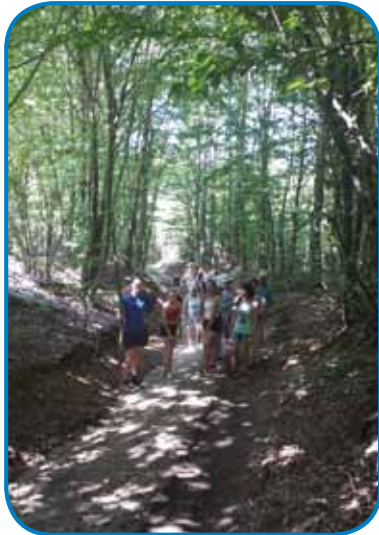
Pot je vodila po starih kolovozih

let, najmlajša, ki se je udeležila pohoda, pa le 1 leto. V naše največje veselje smo našli veliko gob, med njimi tudi velike jurčke. Zato je čas hitro bežal in ob pol dveh smo že dosegli Verico, kjer smo malo počivali in jedli sladoled ali popili nekaj hladnega. Obiskali smo tudi razgled-