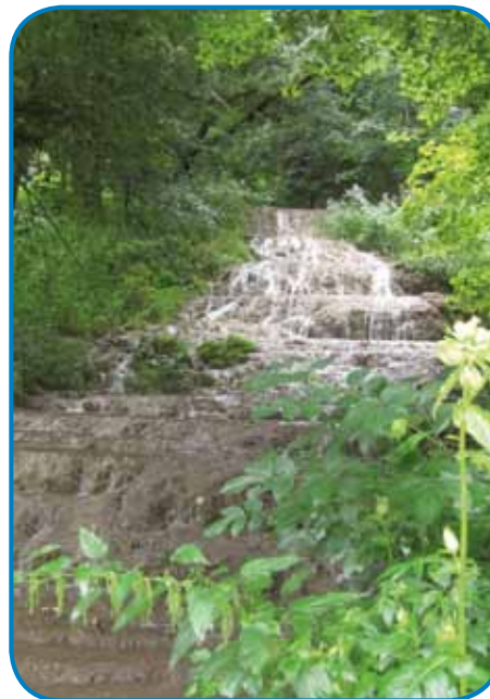
»Šlajerov slap« - od centra vesnice ga leko dosegnemo pejški, z ednov kračišov turov ranč tak

Na bazari smo si küpili fajni sladoled ino za slobaud malo pokukivali nut v stadion - vidli smo samo 16-18 gezdecov. Med potjauv prauti domi sem eške malo klačo svoj telefon, štéri