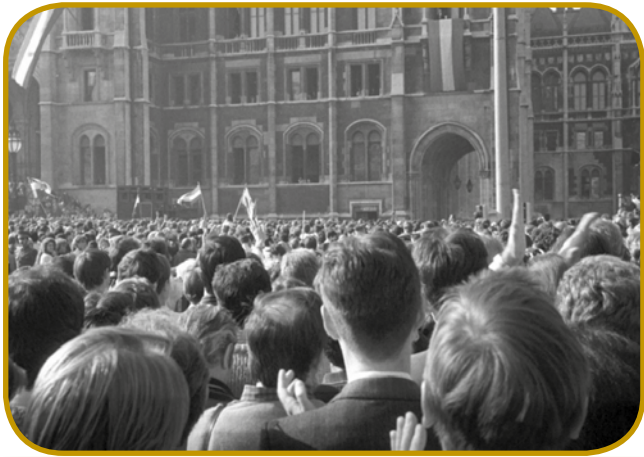
Več deset gezero lüdi se je zbralo na Kossuthovom trgi 23. oktobra 1989, gda je djenau podnék na balkoni Parlamenta Mátyás Szűrös vözglaso »Republiko Madžarsko«

Od sprtolejtja je vse bole naglo gratalo, partijski rosag se je rüšo. Apriliša so vrazmo spistili KISZ, majüša je betežen János Kádár dojpravo s vsej svoji funkcij, juniuša pa so vözglasili, ka se več nej trbej rusoški včiti na šaulaj. 16. juniuša, na znauvičnom pokapanji Imrena Nagya , je svoj eričen guč držo Viktor Orbán , v šterom je terdjo, aj rosag zapistijo sovjetski sodacke. Tau je bilau ranč tak simbolično kak tau, ka je za