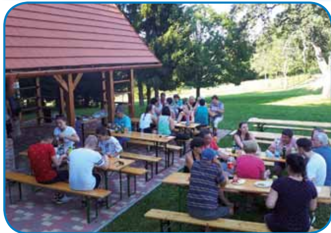
S člani andovskega društva

prijetno popoldne, veliko se pogovarjali in tudi pekli na žaru. Okolico Andovske domačije so preplavile prijete vonjave, nam so se pa cedile sline, saj smo po pohodu bili pošteno lačni. Vse generacije so se počutile zelo lepo. Po večernem druženju smo se dogovorili, da naredimo tradicijo in smo že zdaj povabili člane andovskega društva v Sakalovce.