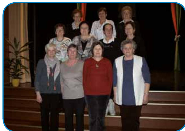
2018-oga leta za štiriletni mandat izvoldjeno 11-člansko predsedstvo

dašnje paversko šego, löjpanje tikvini guškic. Iz programov smo z danešnjim vred že 11 vöspelali. S toga je vodstvo melo 3 djilejše, aj podraubnoma pripravi program