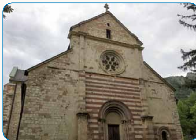
Avstrijski cesar se je s konjami slovenski pogučavo stran 9