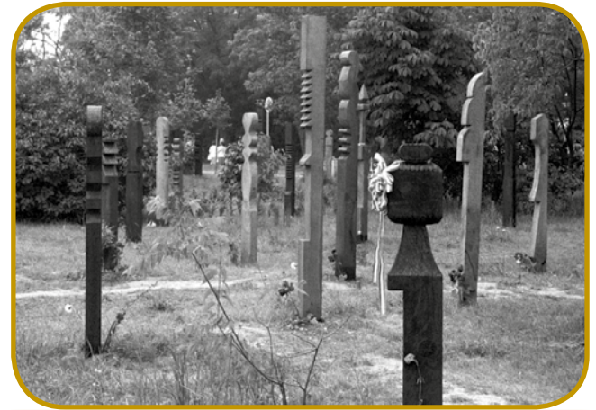
Skupina »Inconnu« je leta 1989 postavila 301 leseni spomenikov (kopjafa) v »Parceli 301«, gde so pokopani mantrniki revolucije v 1956

Gorbačov je vpelo dosta znautrašnji reform: najbolje poznaniava sta »perestrojka« (dinamizacija gospodarstva) ino »glasnost« (dopüščenje oprejte kritike). Začnila se je demokratizacija, na volitvaj marciüša 1989 je v pozicijo prišlo dosta opozicijski lüdi. Gorbačov je dugo rejsan võro, ka leko Sovjetska zveza »sapo vzeme« ino od znautra pa zvüna red napravi. Brodo je, ka se leko s takšimi reformami v vzhodnoevropski rosagaj ranč tak rejšijo problemi ino ž njimi socializem pá popularen grata. Pripravleni je biu, ka nazajpozové en tau