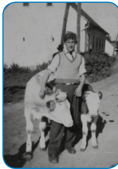
Pri Bautini so vsigdar meli od osem do deset glav mare

»Dostakrat, gda tak čas mam, je gledam pa tašoga reda dosta