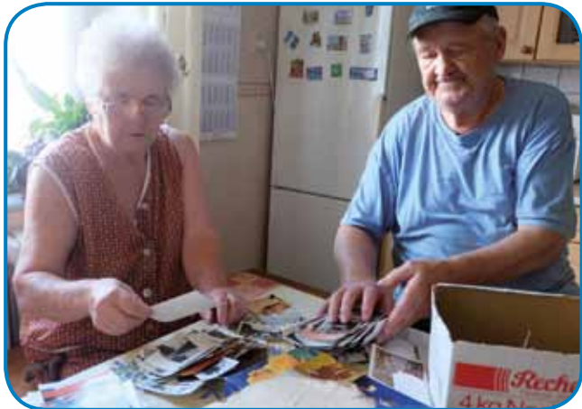
Zženo med iskanjom stari kejpov

mrau, te je že moj oča tō sam živo zato, ka njema pa žena mrla. Tak sta se te spoznala pa oženila, za dveji leta sem se pa dja naraudo.«