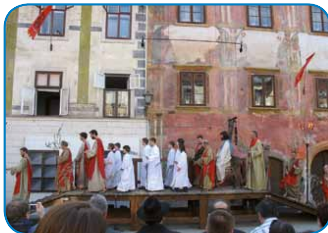
Prizor Škofjeloškega pasijona: Vhod v Jeruzalem (2009)

pasijonov v slovenskem etničnem prostoru, v tem primeru na avstrijskem