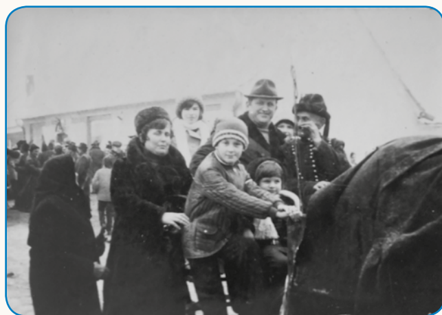
Kaulak bi zopojdo »Zemlo« stran 8