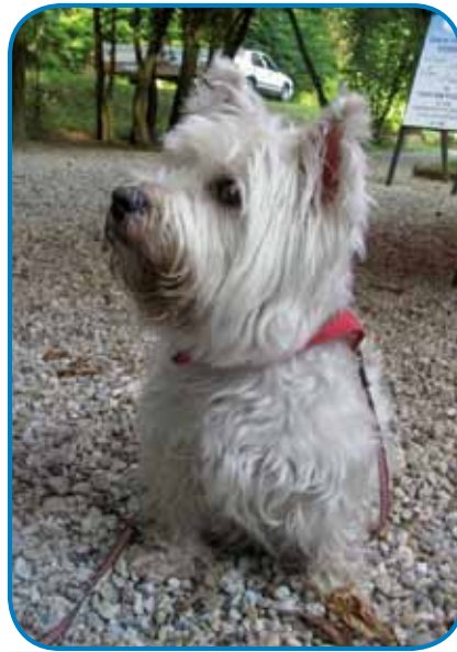
Polonco vsi pri Rituperovih pogrešajo

biou fajm, vej pa je že prvi den nevole mela, in tau zavolo toga, ka je sira nej stela gesti. Gda je prišla domau, je oči pravla, ka more sir küpiti, ka