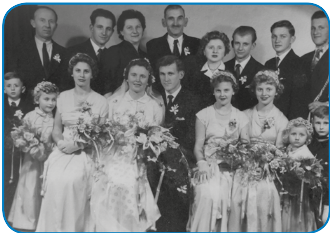
Zdavanjski kejp so dali narediti v Varaši pri fotografiji Tanai

»Zato ka sem dja do slejdnjoga emo konje, dja sem v cejlo življenji foringaš bijo, samo proto konca že nej, gda sem v službo odo v Varaš. Mi smo vsigdar dosta grūnta meli pa vsigdar smo dosta delali. Gnauk smo