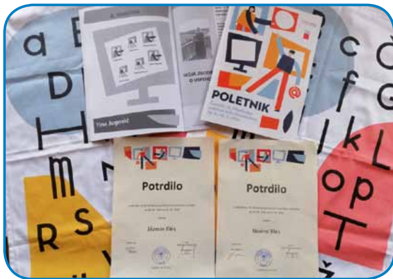
Potrdili in Poletnik sva dobili po pošti

Katera je tista beseda, ki nama zdaj pride na misel?