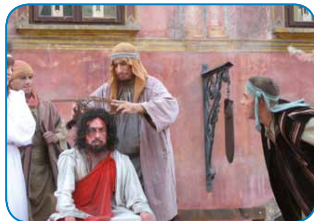
7. podoba v procesiji: Kronanje (2009)

sti Škofjeloškega pasijona so leta 2017 začeli izdajati Pasijonski almanah . Osrednja tema 3. izdaje – ki je izšla z letnico 2019 – je priključitev Škofje Loke in Škofjeloškega pasijona mednarodnemu združenju – Evropski mreži za praznovanje velikega tedna in velike noči v tem letu. Zbornik je namenjen