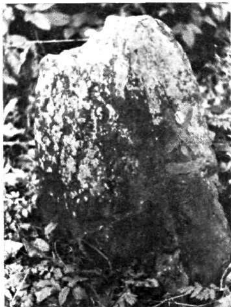
Kamen mejnik iz Volake z vklesano letnico

pred prvo svetovno vojno našli pri kopanju jam za stebre kozolca kamnit kropilnik.